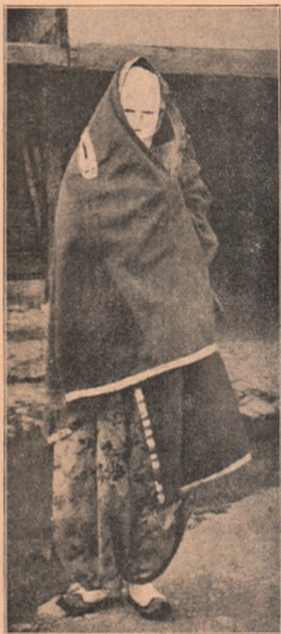
O albaneză musulmană din Scutari.

conformarea omului la natură, găseau pe om inferior naturii; părintele Agârbiceanu proclamând mai mare voința omului de cât legile naturii, găsește pe aceasta subordonată omului. Eu, dacă este să aleg una dintre amândouă, aș alege omul părintelui Agârbiceanu. De altfel, stoicii nu au crezut pe om în fața naturii, tocmai așa cum și-a închiquit viitorimea. Ei n'au susținut că Natura nu se poate schimba. Intreaga filosofie a lor, asupra Naturii se reduce la Bine. Numai natura este și nu se schimbă spune Mare Aureliu ( Cugetări I. 18; IV. 9). Mai categoric însă în privința aceasta este Cicerone când afirmă: „sed quia natura mutari non potest” ( De Amicitia IX 32). Așa dar, după filosoful latin, natura nu se poate schimba. Intreaga antichitate, când filosofia făcea abstracții de om și de materie, după recomandarea lui Platon, și de aceea, omul apare, în acest caz, așa de nepulincios față de Natură! Timpurile moderne însă, cari