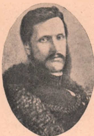
Cuza-Vodă, Alexandru Ioan I.

începe a suflă praful de pe actul încheiat al celui dintâi Domn al României și, desbrăcat de orice preocupățiune, deschide filele acestui act și așează faptele ce cuprinde în lumina rece și dreaptă a istoriei, și acela află, că totuși mare și însemnat e acest cel dintâi Domn, care a șezut pe primul tron al României unite .