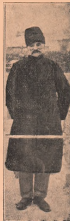
Olteanul care a scos sfânta cruce din apa Dâmboviței , câștigând ciasul de aur.

Obiceiuri de Bobotează la București. În capitala română se face sfințirea apei la Botezul-Dominului, cu paradă foarte mare. Slujește însuși Metropolitul-Primat încunjurat de înaltul cler, și ia parte și Familia Regală. Astan, Regele Carol și Regina, n'au putut lua parte, fiind bătrâni, dar Moștenitorul de Tron Ferdinand și Prințul Carol se văd aici în apropierea sfințiților Archierei, precum și altă lume aleasă. — Sfințirea se face pe țărmul Dâmboviței , râul ce strătaie Bucureștii. Archiereii și Curtea și lumea mare, stă pe un podiu de scânduri clădit anume, pe țărmul Dâmboviței , — și în clipa sfințirii apei, Metropolitul-Primat, aruncă sfânta cruce în apa Dâmboviței — în un loc unde vadul nu e mai adânc ca până la genunchi. Atunci mai mulți țărani sar în apă și caută sfânta cruce și cel ce o găsește, o aduce napoi Archiereului și capătă, ca dar, un — orologiu de aur . Chipul de mai jos ne arată scena căutării crucii și aflarea ei, cel dela dreapta e aflătorul.