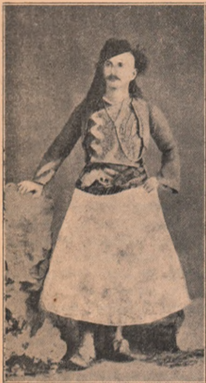
Vederi din țara Principelui de Wied, Albania. În alți numeri ai „Cosinzenei” am arătat vederi de orașe și de edificii din Albania. Țara cea nou răsărită pe cartea Europei. Arătăm azi câteva vederi de porturi naționale albaneze. — Chipul de aci ne arată portul unui bey (deregător) din Soutri.

aibă ceva omenesc în ea, pentru a putea fi gustată de oameni. Nu dela toți nuvelisti însă, se poate cere aceasta. Dealtfel, calitățile mari ale oamenilor niciodată nu se cer și se caută, ci întotdeauna apar prin ele înșile și se impun și se observă prin ele înșile. Scriitorii noștri, cari înfățișează această calitate, se pot număra pe degete. Iar pe de altă parte scriitorii de-ai noștri, cari nu filosofiază ca cei pușini, ci care vor să facă filosofie în opera lor, numărul lor fiind nesfârșit, sunt convinși, că nu s-ar putea număra niciodată. Toți înlăcrimații și toți nesincerii în fața vieții, au umplut și literatura noastră, cu fel de fel de întorsături ale cugățării, invocând toate numele clasice, căci aceste nume au rolul de-a salva ridicolul. După Eminescu a urmat o astfel de perioadă și ea n-a luat sfârșit nici astăzi. De aceea, în fața nuvelilor goale și în fața acestor filosofi literari de duzină, relevez cu bucurie,