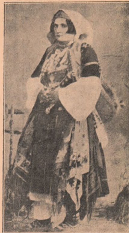
Țărăncă albaneză dela șes.

Părintele I. Agârbiceanu, înainte de toate, este un răscolitor de suflete, acțiunea nuvelilor sale, deși nu au artă, are partea psihologică de care atârână valoarea scrierilor lungi ale scriitorilor ruși. Răscolind patimele omenești, pătrunzând sufletele atâtor fel de categorii de oameni, d-sa a început să vază dela un timp, întreaga alcătuire a naturii și a vieții omenești, din punctul de vedere al cugetătorului. Către aceasta, îl duce mai ales viața rustică în care trăiește și religia creștină pe care o profesază. Această cugetare a d-sale, va trăi mai mult ca a tuturor filozofilor oficiali din finuturile românești. Pentru-ce? Pentru-că ea este rezultatul cunoașterii vieții, ca la Carlyle, ca la Hower, ca la Tolstoi. Când în nuvela Trăsurica Verde d-sa exclamă: „Cum se schimbă un om când altul se uită, la el!”, o mărturisește însuși că, cu această reflexiune, și nu cum crede d-sa, „senzație”, s'a „ales” dintr-o întâmplare petrecută. Da! Toți ne alegem cu judecăți și învățăminte, numai pe această cale și nu pe calea contemplării și cea a Metafizicei! În reflexiunea părintelui Agârbiceanu este adevăr psihologic, este observație dreaptă. Dar această simplă exclamare, această simplă reflexiune, această „senzație”, cum o numește d-sa, în alte părți se preface în cugetarea matură a omului gânditor,