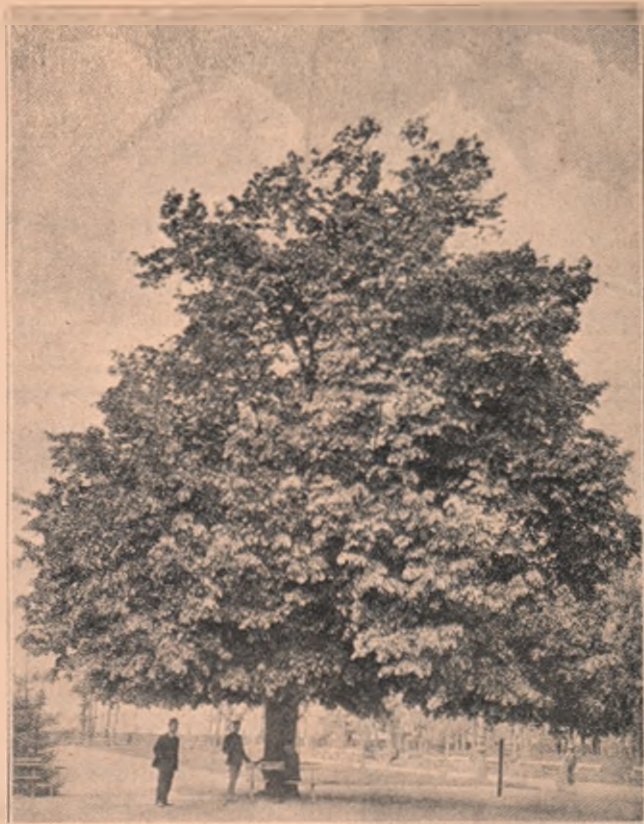
Teiul lui Eminescu.

„Domnia și detronarea lui Cuza-Vodă“ e titlul unei broșuri de 160 pagini, aparută în biblioteca „Flacăra“, spunând toată povestea