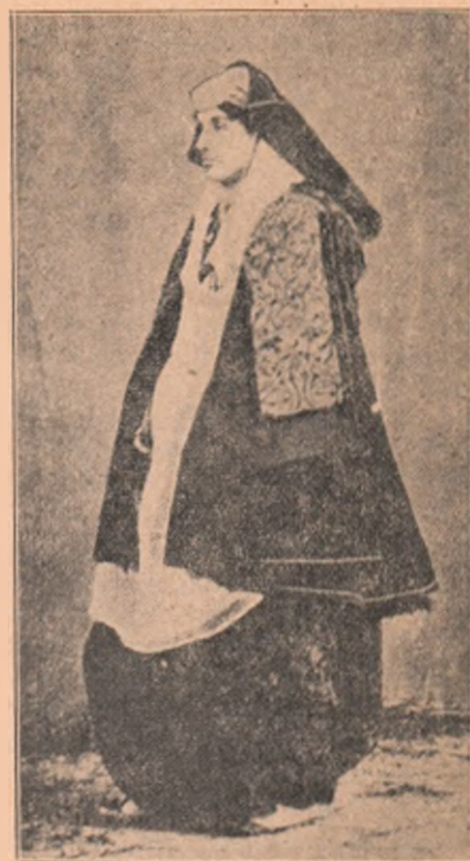
O albaneză catolică din Scutari.

Răspândiți revista „Cosinzeana” între cunoscuții dumneavoastră!