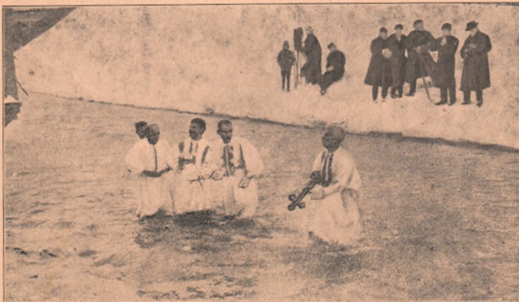
Cei 5 țărani, îmbrăcați de sărbătoare, cari au intrat în râu, căutând sfânta cruce. Unul din ei a găsit-o.

nu a pus Dzeu pe om mai presus de acele ființe și în privința duratei vieții sale în lume ? În privința asta natura e foarte mașteră față de om. Doar e dovedit, că mijlocia vieții omului, luată numai a oame- nilor mari între sine, este de abia 51 ani, iar dacă iei pe mari și mici la olaltă, bătrâni și copii, în o socoteală, — apoi media vieții omenești, abia-i 28 de ani! Așa de puțin, încăl