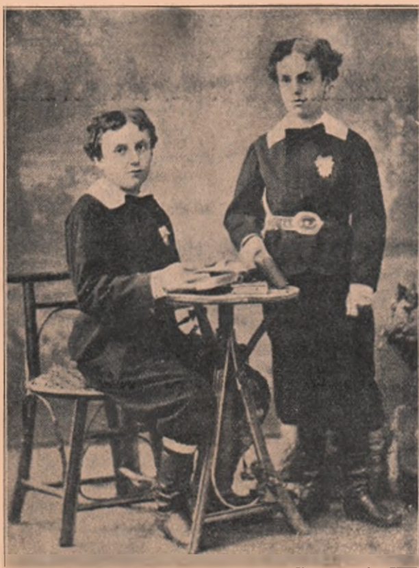
Copiii lui Cuza-Vodă.