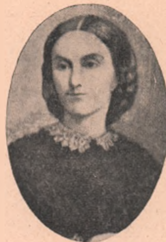
Elena-Doamna, tatăna Doamnă a României unite.

Dar când mai știm, că nu de numele, ci de voința lui de fer, pe care și-o ducea în deplinire chiar și prin lovituri de stat, contra voinței boerilor și partidelor politice ce nu erau așa de liberale și avansate în idei ca el, — este legată pomenirea secularizării uriașelor averi mănăstirești, în folosul statului nou întemeiat; că el a dus în deplinire, contra plăcerii claselor boeresti, împroprietărirea țărănilor ; că a înzestrat țara cu o Constituție nouă , liberală, peste voia guvernului său, supuinu-o aprobării poporului , — apoi toate micile lui defecte, că nu a prea știut „tracta” cu lumea din jurul lui, — istoria dreaptă l le iartă, sau cel mult regretă, că de avea și ceastă însușire, de a ști linguși pe cei din jurul său, făcându-și-i prin asta servi supuși între orice împrejurări, apoi încă multe fapte