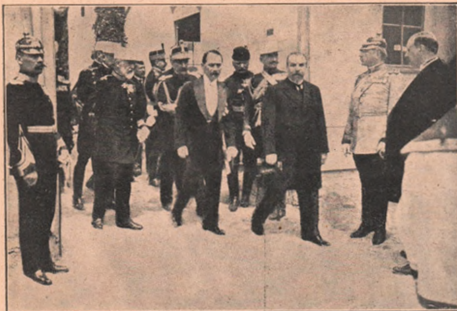
Excursiunea Suveranilor români pe Dunăre: Primirea lor la Silistra. După ce li s'a prezentat și acî pînea și sarea, primarul și ajutorul său, merg înainte, urmași de M. Sa Regele și suita sa, spre lăuntru orașului.

mai presupuneri și scornituri. Nu se mai vorbește nimic de Basarabia, care, se afirmă acu-s căleva luni, va fi redată României, ca zestre cu Olga ori Tatiana. Nu se vorbește nici de logodna prințului Carol, care, se spune, că din acest prilej va fi publicată oficios. S'au dat toate uitării și se trimbișă numai luxul roșiorilor, numai ovațiile furtunoase cu care țarul a fost primit și salutat de Suveranii români. Parc'ă înadins e scoasă dintre șirele rapoartelor politica și miezul acestei vizite împărătești. Tăinuirea aceasta pe noi ne bucură, căci locmai ea arată, că în Constanța s'a pus la cale un lucru mare, un lucru de valoare și mulțumitor pentru noi. De ce să-l spunem dușmanilor? Ca să ne pizmuiască?