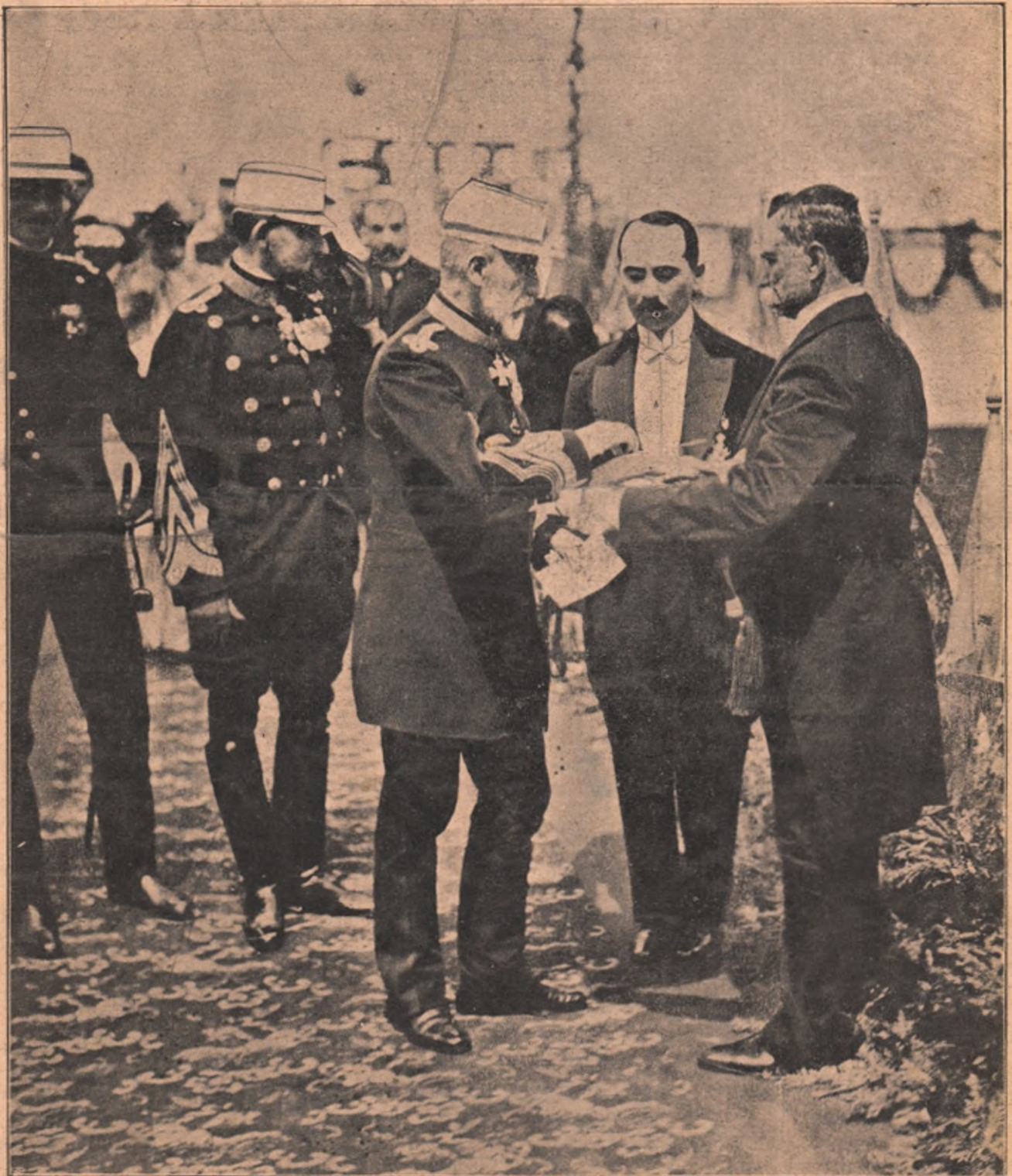
Regele Carol și Principele Ferdinand, sosind în Turtucaia. Primarul orașului le oferă pe tavă de argint pâne și sare, în semn de supunere.

— Vezi interviul „Cu pâne și cu sare” pe pagina 346. —