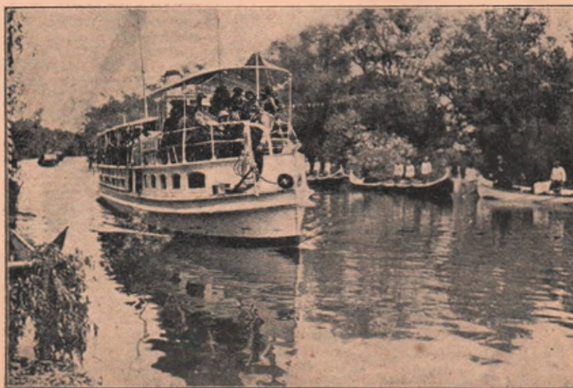
O plimbare pe Dunăre cu șalupa. E. M. S. regele Carol și familia, la gurile Dunării, la Galați, unde făcând o pauză mai bună, a făcut și o plimbare cu șalupa pe fluviu.

Sunt de atunci vreo patru ani, spune povestitorul. Aveam în curte un câne mare și frumos, care sămăna mult cu un dog, cânele zăvod cu botul mare. Eră îngrijit foarte bine și totdeauna chemam un bărbier să-l tundă, ca să fie mai puțin năcăjit