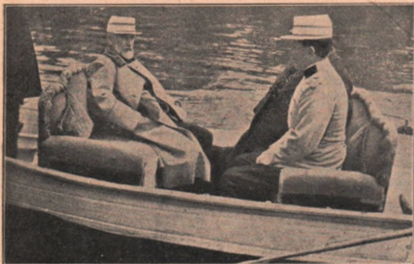
O plimbare cu barca pe Dunăre. S'a pus pentru augustul excursionist un fotel în luntre și așa e dus la plimbare de văslași isteți.

a ne analiză pe noi pentru a ne cunoaște și îndreptă, și scrise într'un stil caracteristic talentului său, de un rafinat causeur francez, care-l ajută să-și mascheze vasta-i erudițiune.