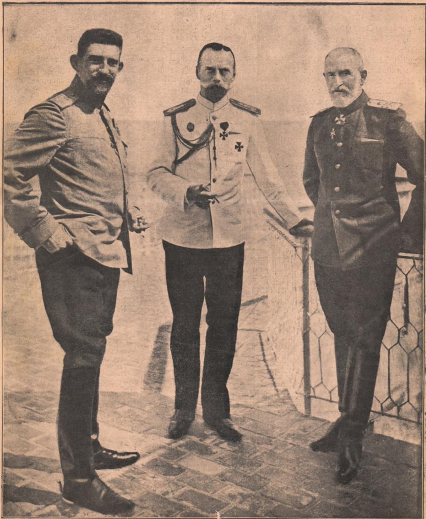
Capii destinelor din Balcani: țarul Nicolae II., regele Carol al României și moștenitorul de tron Ferdinand.