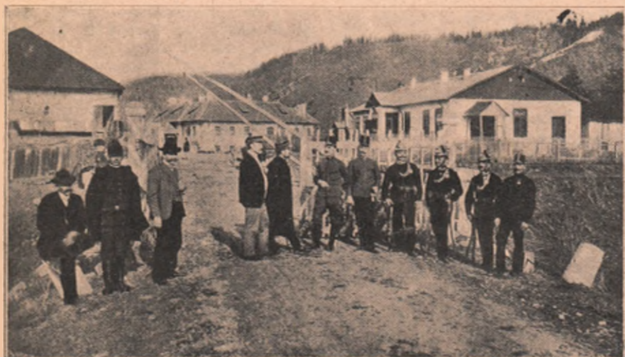
Vedere din Tulgheș: Granița româno-ungurească.