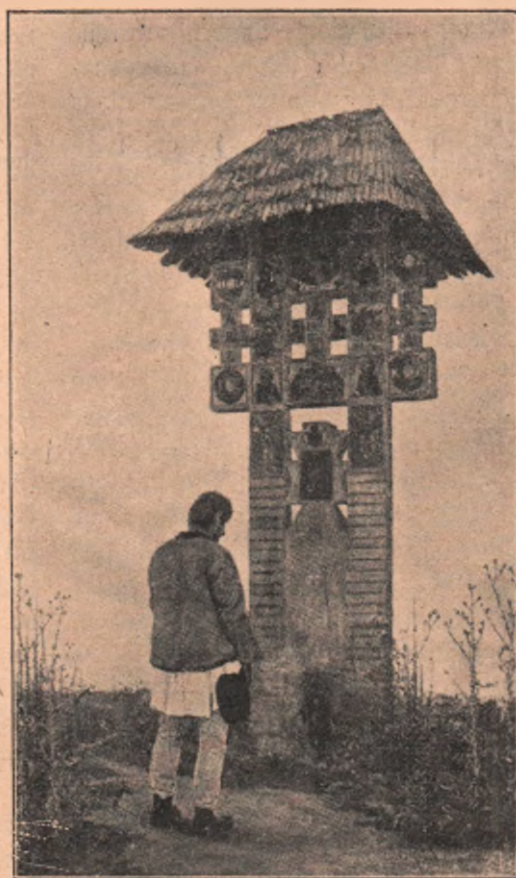
Un monument de artă țărănească: La cruce. Cinstitul și blândul Român și-a descoperit înaintea sfintei cruci capul și rămâne o clipă cu gândul dus la cele vecinice. Icoana Mântuitorului și a celorlalți sfinți de pe cruce, o crede atotputernică și-i cere ajutorul pe drumul, pe care a pornit.

Aceste două ilustrații le dăm după albumul de fotografii a domnului I. Voinescu, care a adunat o mulțime de monumente de artă populară, contribuind în nespun de mare măsură la conservarea acestor însemnate lucruri, cari oglindesc așa de viu talentul și hărnicia țaranului român. Meritul domnului Voinescu e îndeosebi mare, fiindcă dânsul, — când alți cărturari se interesează așa de puțin de viața artistică a poporului, — nu pregetă a cutreeră satele în larg și 'n lat, și a prinde în mașina sa de fotografiat tot ce-i interesant, frumos și tipic popular, numai ca să treacă pe placa conservatoare aceste frumșeți naționale și ca să ne deschidă și nouă ochii și să ne facă să vedem dibăcia fraților dela țară, ca apoi, în consecință, să-i știm prețui mai mult și să ne fie mai dor a face de prin cele orașe câte o excursie la ei, cu scopul, de-ai povățui, a-i îndemna la lucruri din ce în ce