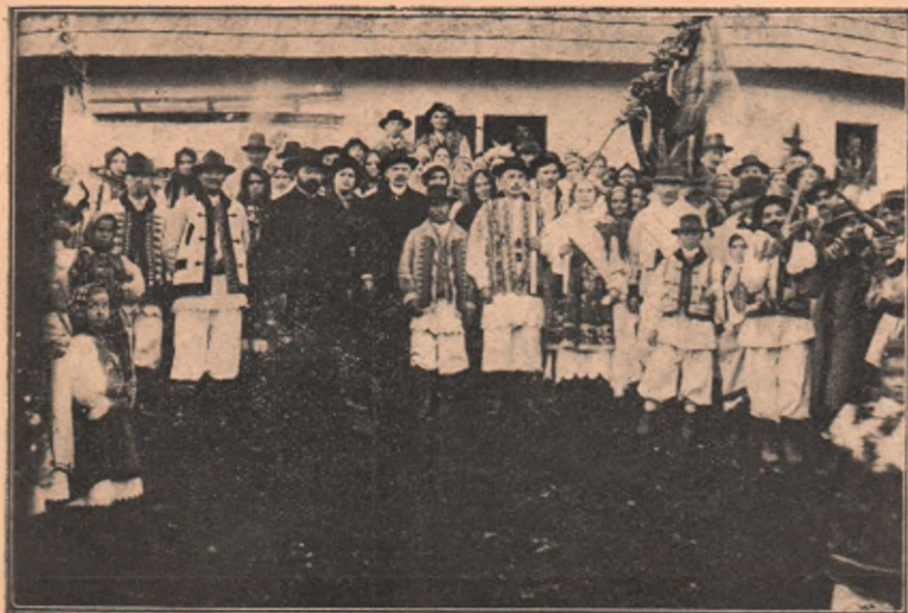
O nuntă țărănească din Zorani, lângă Margine, în Bănat.

iau parte și factori mai potoliți, se hotărăște pentru concert.