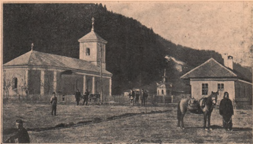
Vedere din Tulgheș: Biserica gr.-cat. română.

— O, Doamne, tinerii de astăzi cum sânt! Amână atâtea petreceri din vara asta, par'că n'ar mai avea de gând s'o țină. Anul trecut pe vremea asta sosiseră deja invitările. Desigur. Dar acum de ce nu mai vin?