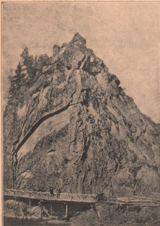
Piatra Corbului din Bicz, în județul Neamț, România.

— Eu sunt creanga verde, care Poartă floarea tinereții, Eu sunt creanga verde n care Murmură fluidul vieții.