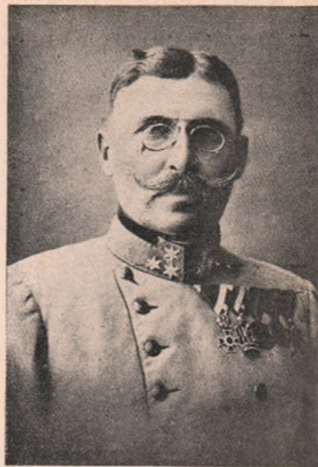
Generalul Auffenberg, inspector al armatei, eroul dela Tamos-Tysovetz, care alături de Dankl a dus lupte brave pe pământ rusesc. Acum s'a retras cu Dankl cu tot la matca (centrul) armatei, din jos de Lemberg.

Oare dintre cele trei tipuri de ziariști, cari sunt mai de folos pres-