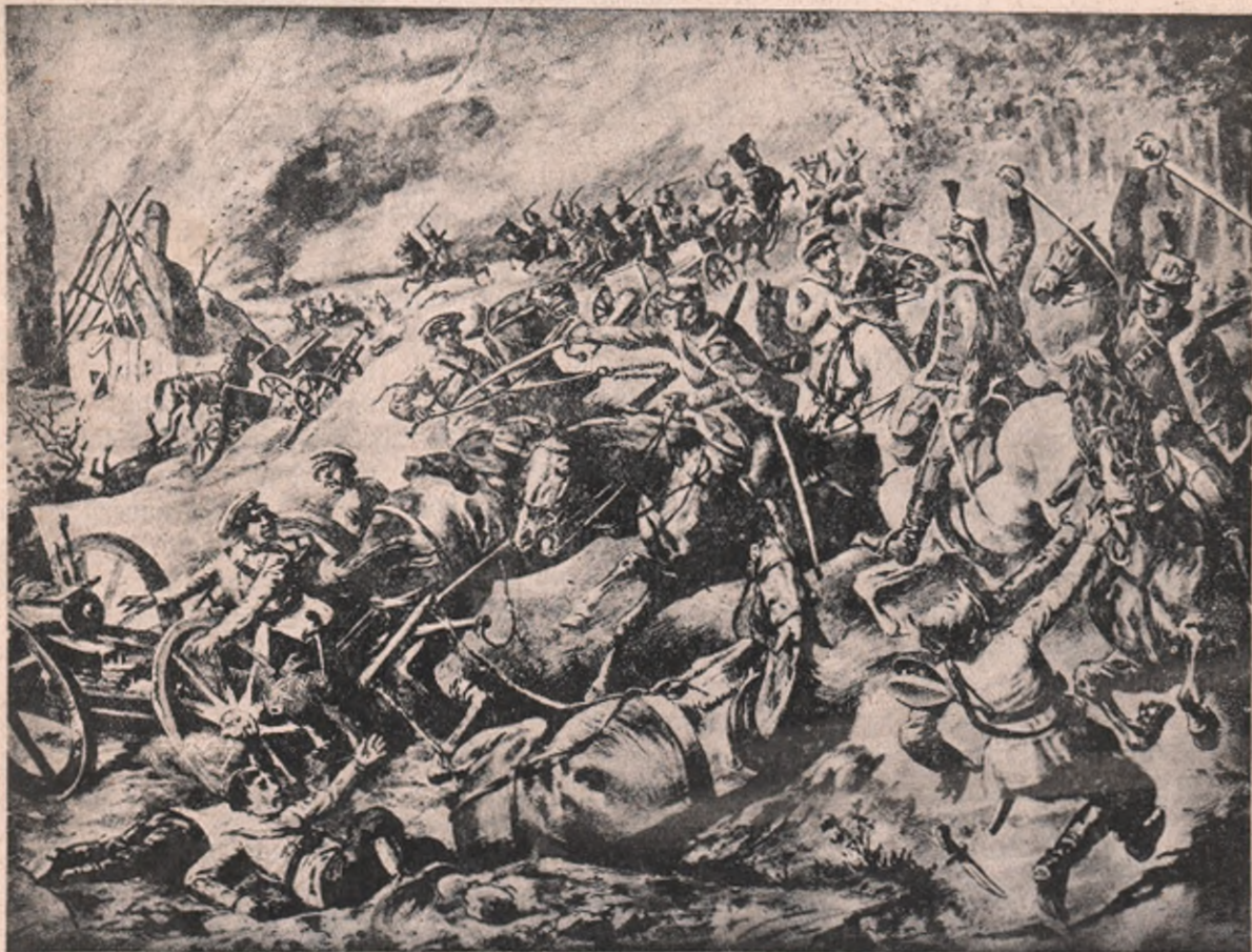
Cumplit atac de cavalerie la Sattanov, în Rusia. E divizia de husari-honvezi, care, trimisă în o periculoasă recunoaștere, a suferit acolo grele pierderi, dar a și făcut stricăciuni în dușmanii cari o împresurau.