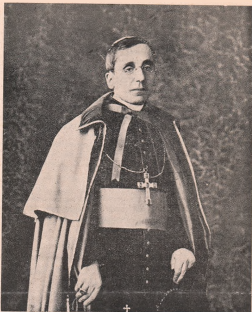
Noul Papă, care își ocupă tronul sub numele de Benedict XV.

Poate mai des se află obiecte cioplite din nefrit. Despre originea acestor obiecte, părerile sunt dife-