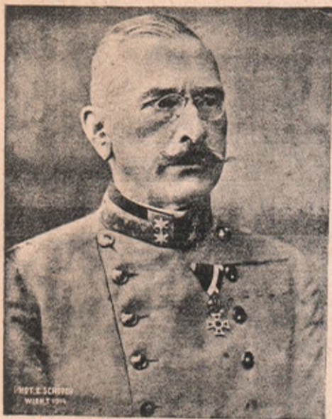
Generalul Dankl, comandantul aripei stânga a armatei austro-ungare luptătoare în Galiția, eroul dela Krasnik și Duza. Retras acum, cu generalul Auffenberg, la matca (centrul) armatei, sub Lemberg.