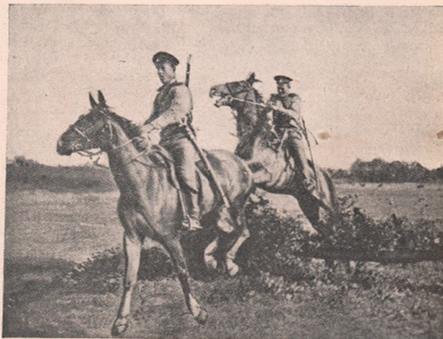
O patrulă de călăreți ruși în avantposturi.

Apoi, ce însemnătate colosală li se va da învingerilor cât de mici, venite din parte dușmană, dacă dușmanii nostri sunt atât de amărâți și prăpădiți. Vedeti, publicul nostru crede că Franțuzu cât ce vede un neamț, se zvârle pe burtă, și că Rușii așa au tulit-o de frica noastră, și până la Irkutsk cu siguranță nu se mai opresc!, — de sârbi nici să nu mai pomenim, — ș'apoi dacă din întâmplare omul dă cu ochii prin vr'un colț de jurnal de o știre strecurată care spune că vreo patrule de a noastră s'a ciocnit cu inamicul, dar acela încă a tras câteva focuri de carabină, ori că: din tactică ne-am retras, etc., din încrederea cea mai mare îi vezi pe oameni numai cum se în-