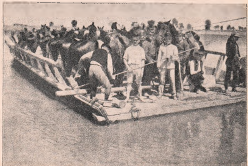
Patrulă de husari, trecând Sava în cin (brudină), pentru a intra în Sârbia, în scop de recunoșcare, de șpionare.