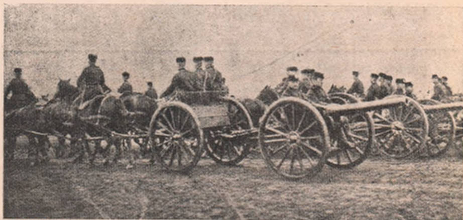
Artileria engleză, în marș spre câmpul de luptă.