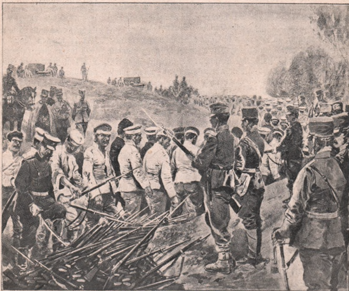
Desarmarea prizonerilor ruși, prinși în lupta dela Hutzwa, de oastea generalului Aufferberg. Ei și-au aruncat armele grămadă și trec fără arme printre șirele de soldați de-ai noștri, în prinsoare.