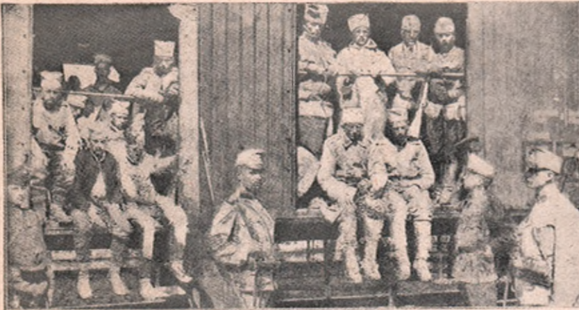
Prinsonieri sârbi din lupta dela Mitrovița, aduși în prinsoare în orașele din țară.

cavalerie inimică, să-și rupă caii picioarele în drot. Infanteria se cadă grapă în dinții lui. Apoi vin șanțurile în cari stau ascunse tunuri cari să primească de departe pe inimic cu improșcaturile șrapnelor potopitoare. Dacă acestea ar fi silite a se retrage, rămâne în front linia I., II. și III. de infanterie; la spatele ei brăul de forturi, cari sunt grozave cuptoare de foc ce stropesc pe dușman pușcând peste șirele de infanterie. Pe la spatele lor sunt trenuri ce aleargă ducând de colo colo trupe și muniții și hrane.