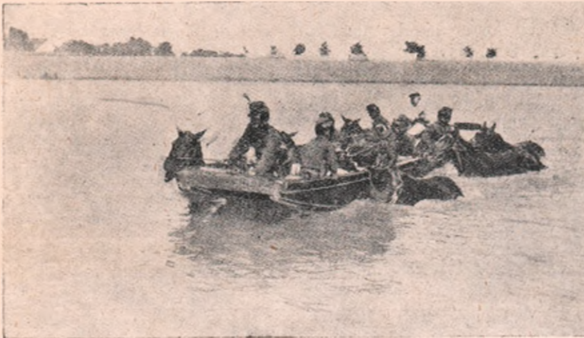
Patrulă de husari-honvezi, trecând Sava în luntre, pentru străbătere în Sârbia.

Lucrul se explică ușor dacă ne gândim, că cu hardughiile de pe la 1650 se parcurgeau cel mult 60 km. pe zi, iar cu expresurile de astăzi se pot atinge 100 km. pe oră!