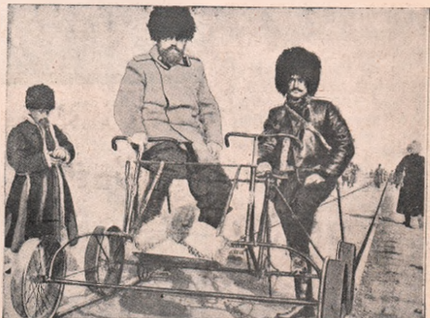
Cazaci de Don, în patrulare de avantposturi. Pe unde este linie ferată, ei se duc pe quadriciclu (cărucior împins cu mâna pe șine), și fac serviciu de spionagiu armatei lor.

Cu trăsuri mari de automobil, se transportă cu iuțea fulgerului trupe întregi, cari pe jos ar avea relativ mișcare de melc. Dar și după ce trupele sunt așezate la locurile hotărâte de conducere, pentru întreținerea legăturii dintre ele, automobilele fac servicii neprețuite. Oficierii au puțința să treacă dela un detașament la altul, ducând ordine grabnice, însufletind pe cei mai slabi de înger, ori împărțind măsuri de urgență. Mari servicii fac mașinile acestea și la transporturi, la posta de campanie, la trupele speciale. În caz că automobilul întâlnește inamic în