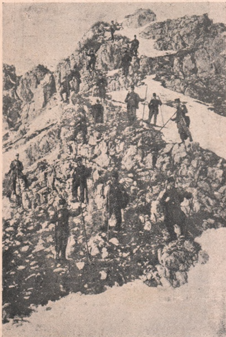
Opăcirea Rușilor în Carpați: Patrula de-ale armatelor noastre, sus pe stânci, pândind depărtările, ca la ivirea inamicului, să se adune și să le ație calea.

voinicii noștri frați și fii, cum se sting în neagra străinătate, lipsiți de fericirea de-a avea la căpătâi o mângâiere dulce de mamă ori o vorbă scumpă de soție, care să le alineze chinurile prin cari trece un muritor la nemurire! Câte suflete rămân cernite pentru întreaga lor viață, și câte inimi nemângăiate în veci pe urma color dispăruți!