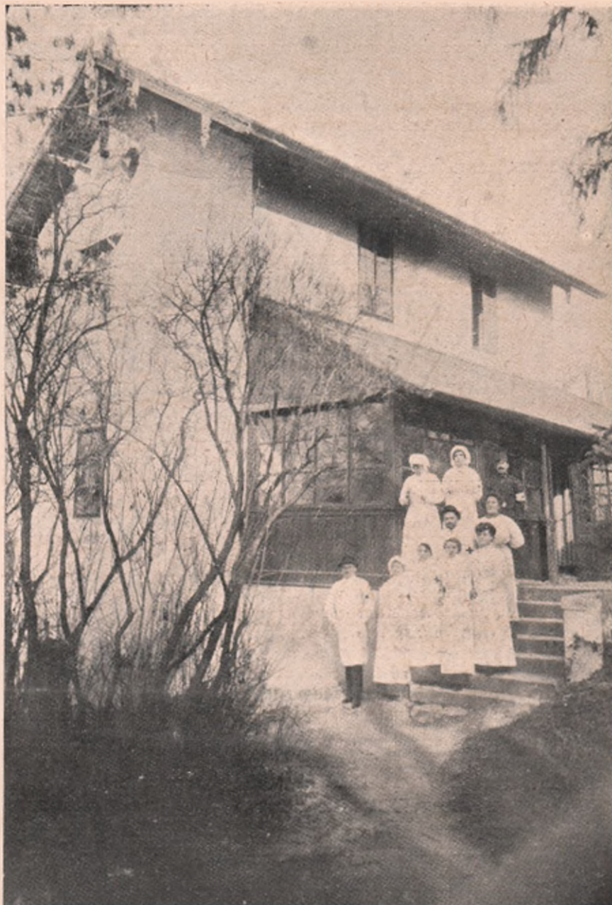
„Ambulanța Petran” — spital românesc în Cluj: — Medicul-șef și surorile de caritate și celalalt personal ajutor, în fața spitalului.

În fiecare an, ziua nașterii Mântuitorului, e pentru noi, cei dela această revistă, îndoită sărbătoare: Cu acest prilej noi sărbăm odată, cu toți creștinii, pe Cel ce s-a născut, ca să ne mântuiască de păcatul strămoșesc și sărbăm apoi, a doua oară, renașterea revistei acesteia, care cu această sărbătoare începe totdeauna un nou an de viață, un nou an de muncă, de jertfe și de mișcare culturală românească! De data aceasta