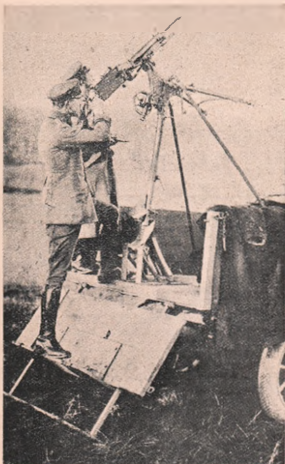
○ mitralieză franceză, luată dela ei în războiu, e întoarsă acum de Germani asupra mașinilor de zburat franceze...

Are să se dea o bătaie mare la Ypers, care va deschide drumul. Și Rușii! Fac bine ci ce fac. Dar ce au de gând să facă Bulgarii? Interesul lor este să lase pe Români să intre în acțiune cu aliații? Ați citit articolul lui A. D. Xenopol? Are dreptate: la primăvară o să vedem lucruri mari!