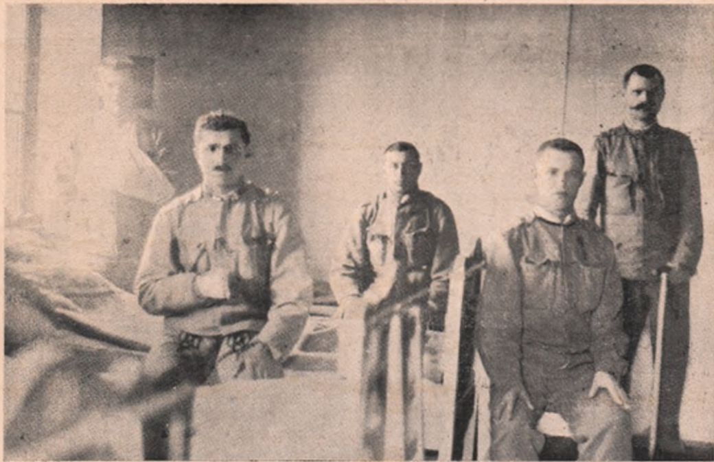
„Ambulanța Petran“ — Cluj: Un grup de răniți și bolnavi.

Străbătuți și azi, ca și acu-s 4 ani, de aceleași gânduri și de aceleași idei, — începem noul an de viață. Alături de gândurile noastre senine și frumoase, stau cetitorii nostri aleși, al căror sprijin îl reclamăm îndoit de mult de data aceasta. Nu numai vremile sunt mult mai grele și nu numai împrejurările excepționale de vitrege pentru desfășurarea steagului nostru, ca să ne îndemne la aceasta, ci și cadrele de dezvoltare, ce ni le vom impune în anul, pe care-l începem. Odată cu potolirea furtunei, noi simțim, că noi cărări vom începe, și o nouă dezvoltare, mai frumoasă, mai plină de nteles și mai plină de roode. De-aceea, rugăm pe toți cetitorii nostri, ca de data aceasta să ne stea îndoit de mult în ajutor. Nu numai dâșii să-și renoiască abonamentele, pe anul, care vine, ci să ne câștige totodată și alți abonași noi, dintre prietini, cunoscuții și neamurile lor!