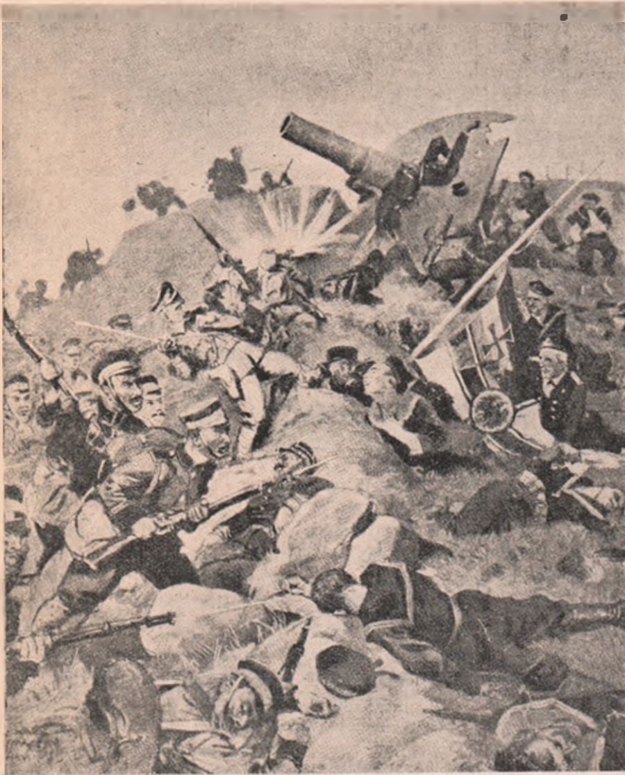
Căderea fortăreței germane Tsing-Tao, de pe coasta Chinei, în mâinile Japonezilor: Vederea ultimului asalt dat de Japonezi și Englezi contra cetății care, timp de aproape trei luni, a opus o rezistență eroică.