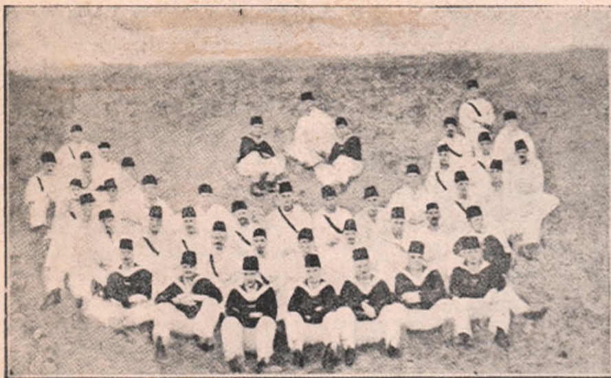
Marinarii germani, încorporați în marina de războiu turcească, au înlocuit bereta cu fesul.

grafic pe ambasadorul meu pe lângă Sf. Scaun, să informeze pe cardinalul secretar de stat că guvernul meu primește din inimă în principiu această idee generoasă și se va grăbi a începe tratări cu statele pe cari aceasta le privește, spre a ajunge la realizarea practică a propunerii Sf. Voastre“.