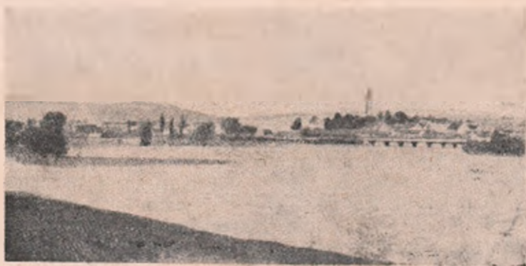
Luptele din regiunea Lacurilor Mazuriene. Vederea satului Nicolaiew, centrul sângeroasei bătălii, în care generalul Hindenburg a raportat asupra Rușilor o victorie strălucită.

Făcusem o prinsoare cu un prieten că dacă, în loc să scriu cărți de astronomie populară, a-și tipări un almanah cu preziceri mincinoase,