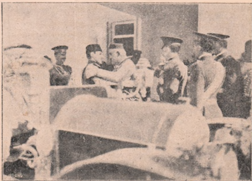
Regele Nikita al Muntenegrului, îmbrățișând pe Principele Alexandru al Sârbiei.

Pentru păstrarea libertății noastre de acțiune, deci, vă rugăm, dom-