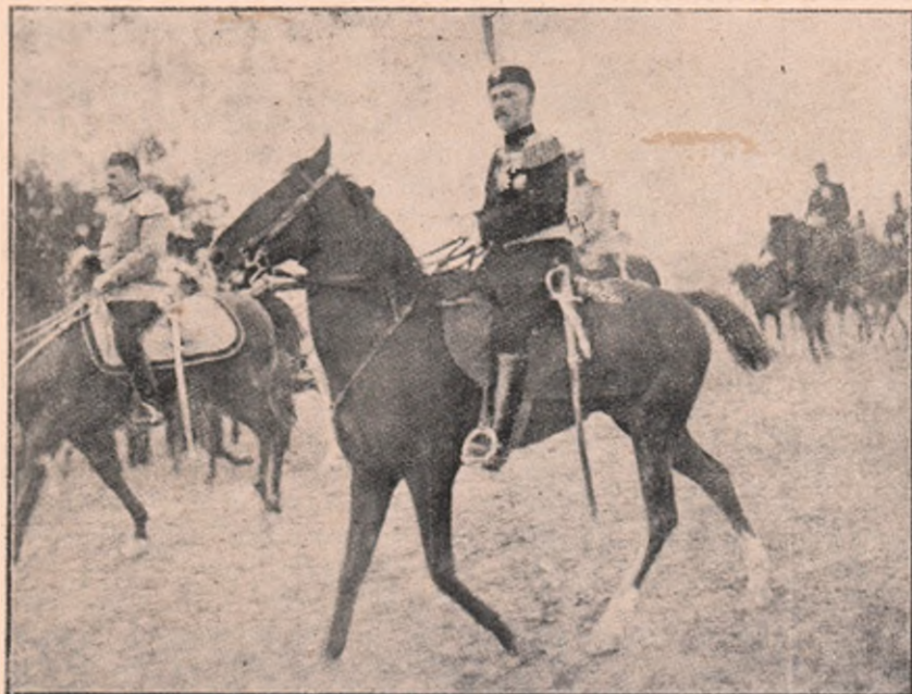
Generalul Putnik, Șeful Statului Major General al armatei sârbe.

dă o porțiune de mâncare mai mare ca de obicei, rostind cuvintele sacramentale: „Dormi bine, muncește cu spor și bine“!