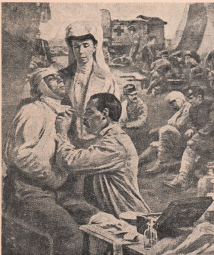
Regina Elisabeta a Belgiei, ca soră de caritate, ajută pe un medic la pansarea unui rănit la o ambulanță sanitară așezată la 4 km. numai de linia de foc.

m'ași îmbogăți în câțiva ani de zile. Noroc că mi-e mai drag adevărul cu toată sărăcia și necazurile lui. E o luptă veche a celor puțini în contra adorării minciunii sub diferitele ei forme și victoria tot nu e aceea care trebuie să fie, de oare-ce cultura e prea puțin răspândită și prea superficial acolo unde e răspândită.