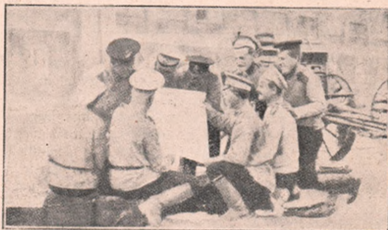
De pe câmpul de luptă din Galiția: După terminarea unei lupte sângeroase, soldații ruși se află adunați în fața primăriei din satul unde li s-a distribuit scrisorile și gazetele de acasă.

Prin această nu se decise încă definitivă soartă a Varșoviei. A treia