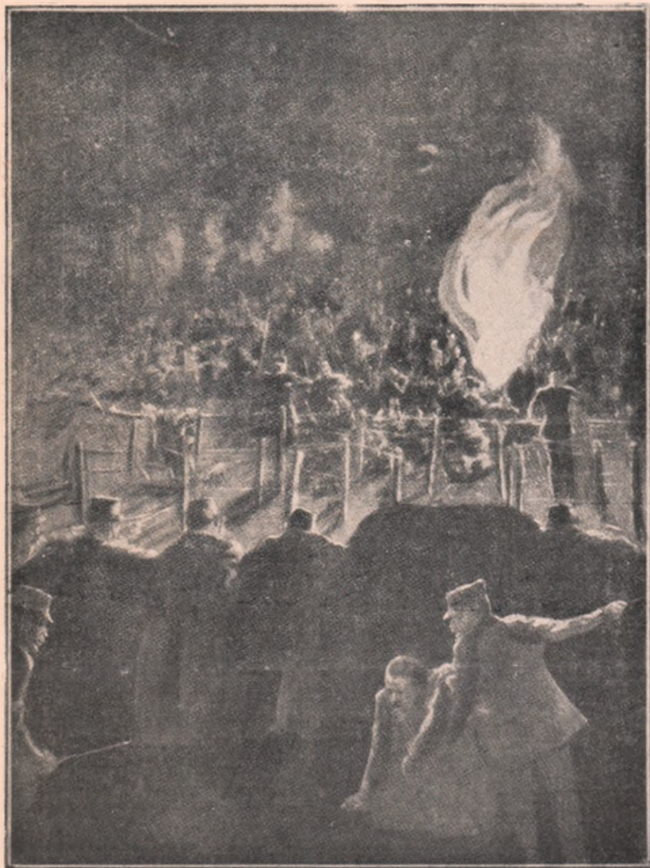
Luptele din Nord-Vestul Franței: Un detașament de infanterie franceză (în planul întâiu) se nizește să oprească cu focuri de salvă inaintarea unui detașament german care vine să ia cu asalt obstacolele garnisite cu garduri de sârmă cu țepi, cari apără pozițiunea disputată.

perfecționat. Dar aici personajul se schimbă. Lângă un pod, în mijlocul apei, stă un pescar și prinde pește.