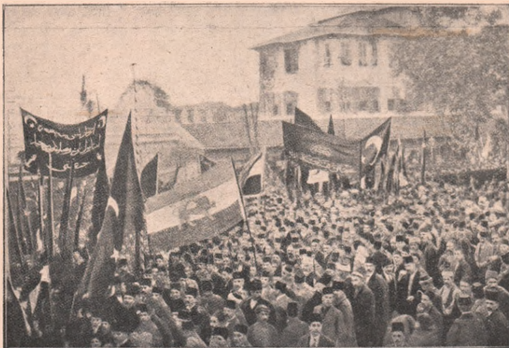
Războiul Sfânt: O manifestație războinică a populațiunii din Constantinopol în fața Seraskieratului (ministerul de războiu).