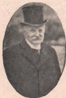
Bulow, noul ambasador al Germaniei la Roma.

O, am trecut și noi, har Domnului, peste vremurile când nu ne vedeam săturați nervii de otrava știrilor de senzație. Azi trecem pe lângă știrile de războiu și nu le cetim, vorbele goale nu ne mai excită fantazia. Fapte, fapte împlinite am dori să vedem odată!..