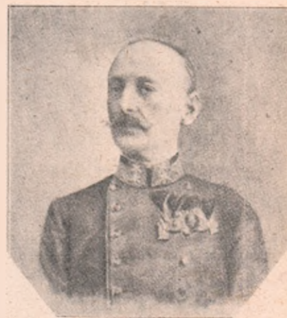
Generalul Ștefan Sarkotits.

dânc înscrise în sângele și inima omului, încât a fost de ajuns îmbrăcarea unei uniforme și ascultarea unui sunet de goarne, pentru ca – omul cavernelor, al peșterilor din vremile străvechi, să se deștepte!