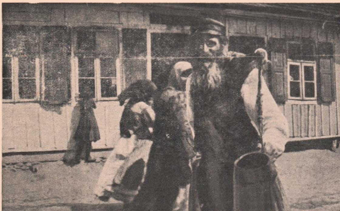
Evreu din Galiția refugiat în Ungaria, din calea Rușilor.

împărțire a Poloniei făcu Varșovia posesiune prusiană. La 28 Noembrie 1806 o ocupară Francezii și în pacea dela Tilsit — dictată de Napoleon I. — Varșovia deveni capitala noului ducat al Varșoviei. În anul 1814 Varșovia căzu iarăș în mâinile Rușilor. Dar Polonezii se răsulară din nou în contra domniei rusești.