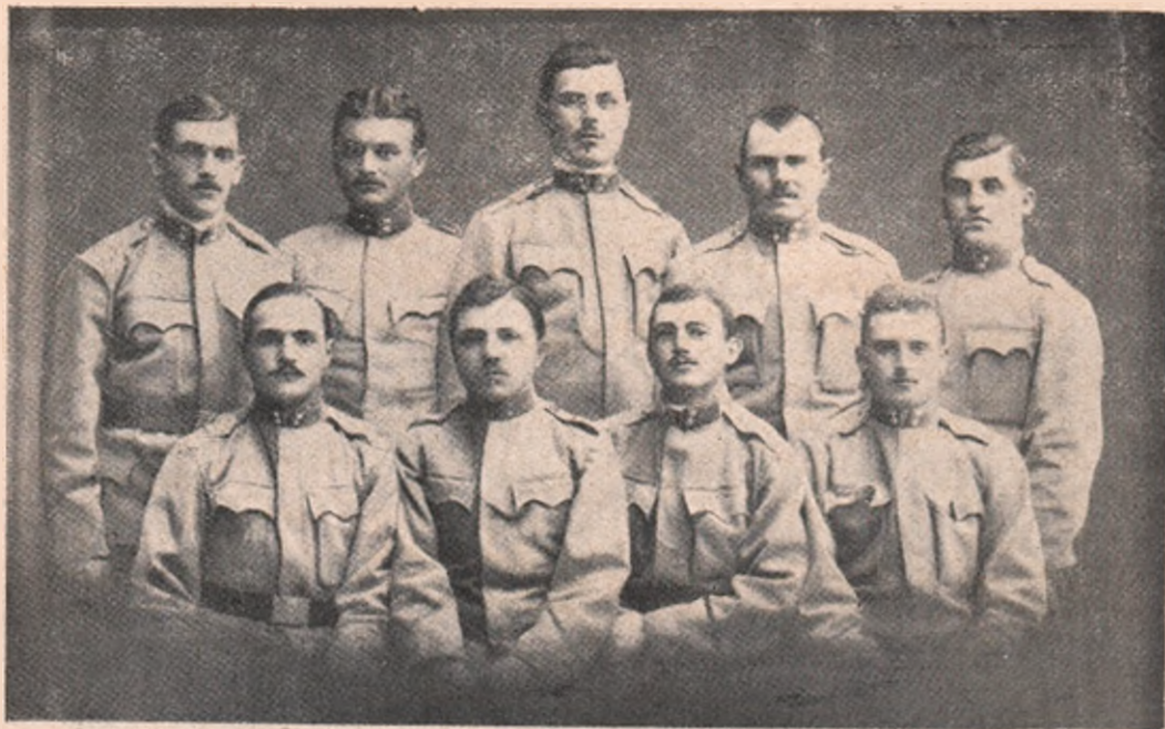
Un grup de voluntari români din Cluj, plecați acum de curând pe câmpul de luptă.

sau chiar toamna lui 1915, cum ar fi trebuit să fie... Chiar dacă s'ar reuși însă, — punerea pe picior de luptă o să fie escadra aceasta în loc cu cel puțin diferența aceasta de timp.