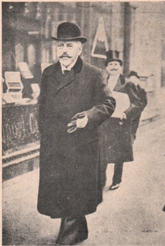
Baronul Stefan Burian : noul ministru de externe al Austroungariei.