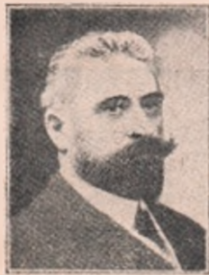
I. I. Brătianu, Prim-ministru și Ministru de Război