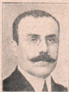
C. Angelescu, Ministru Lucrărilor Publice.