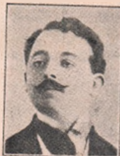
V. Antonescu, Ministru de Justiție.