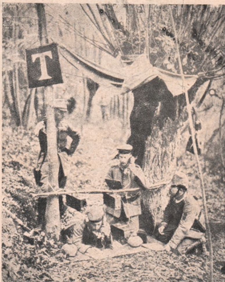
Razboiul german. O stațiune de telefon a trupelor germane pe câmpul de luptă de lângă Soissons.

Dacă adăugați acum bastimentele construite în Anglia, pentru comptul marinelor streine, și pe cari Amiralitatea a pus mâna imediat după izbucnirea conflictului, veți împărtași desigur încrederea pe care o exprimă pe la mijlocul lunii Noemvrie la Guildhall (primăria din Londra) primul lorg d. Winston Churchill.