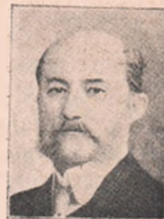
Em. Porumbaru, Ministru de Externe.