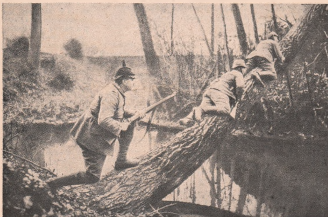
Lupta dela Soissons. Patrulă germană spionând poziția inamicului în lupta dela Soissons.