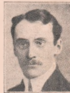
I. G. Duca, Ministru Instrucției și al Cultelor.