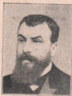
V. Morțun, Ministru de Interne.