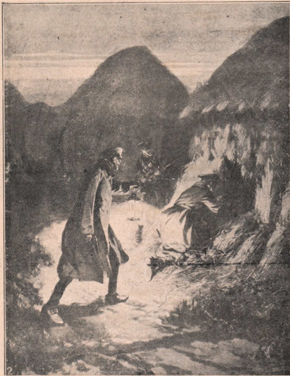
Ofițeri englez căutând după mitraliezele germane ascunse prin clăile de fân, pe câmpul de luptă din Flandria.