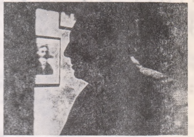
George Călinescu în vizită la Muzeul din Craiova