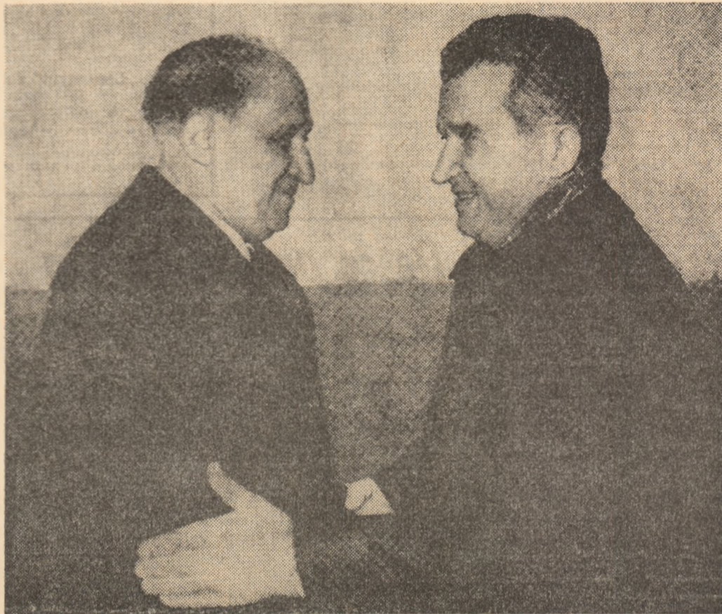
Desfășurată în aceeași atmosferă cordială și prietenească ce a caracterizat întîlnirile din august și septembrie 1972 — și continuîndu-le firesc — recenta vizită de prietenie a tovarășului Nicolae Ceaușescu în Bulgaria s-a concretizat în hotărîri comune de o înaltă semnificație pentru dezvoltarea viitoare a colaborării multilaterale reciproc avantajoase.

Orînia publică din țara noastră nutrește ferma convingere că întîlnirea dintre tovarășii Nicolae Ceaușescu și Todor Jivkov, rezultatele importante ale acestei recente vizite constituie un eveniment de o deosebită semnificație pentru dezvoltarea continuă a relațiilor româno-bulgare în interesul ambelor popoare, al țărilor socialiste, al cauzei securității și păcii în Europa și în lume.