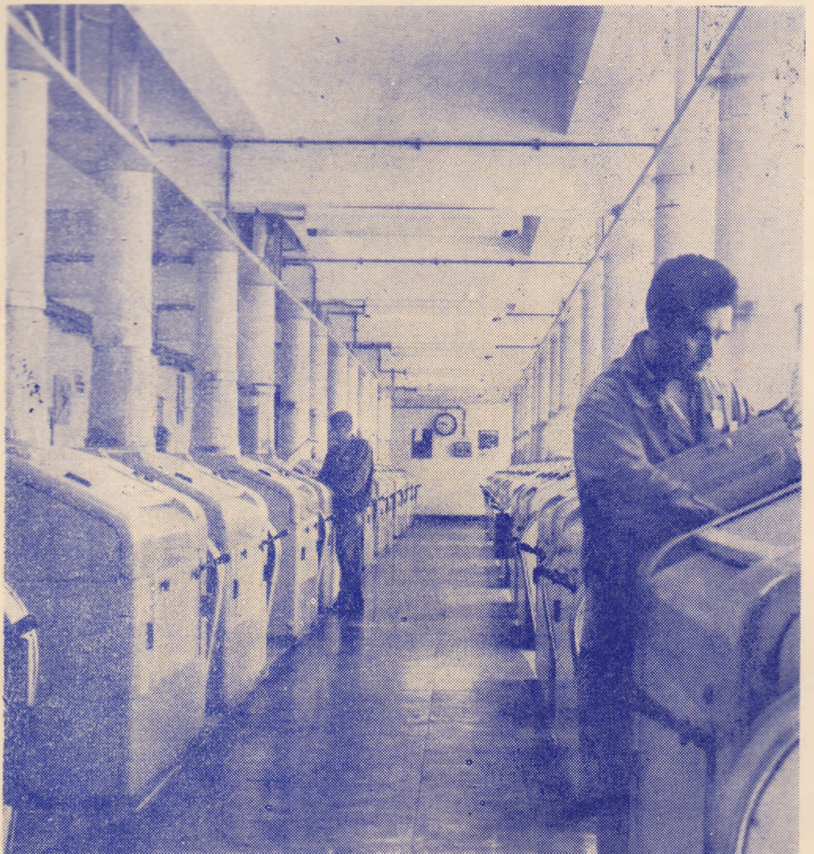
Aspect din secția morărit

Așadar, preferați numeroasele produse ieșite de la C.I.M.P. — Iași, o fabrică intrată în preferințele tuturor virstelor.