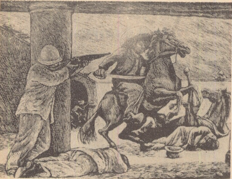
Leopoldo MENDEZ :

O vibrantă conștiință socială, tensionată pînă la paroxism, un suflu năvalnic de viață și aspirații, o voință neștrămutată de afirmare a dreptății, a binelui și adevărului străbat această expoziție de la un capăt la altul, înfățișându-ne aspecte extrem de