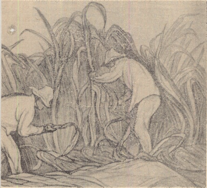
INS : „Tăind trestie de zahăr“