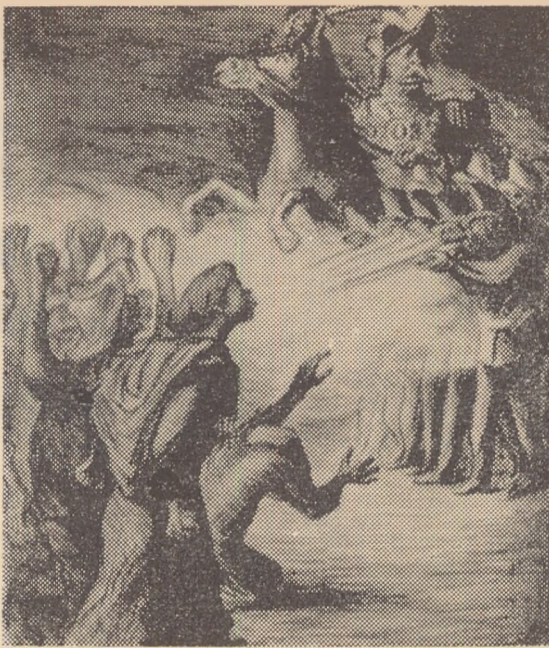
Leopoldo MENDEZ : „Porfirio Diaz“