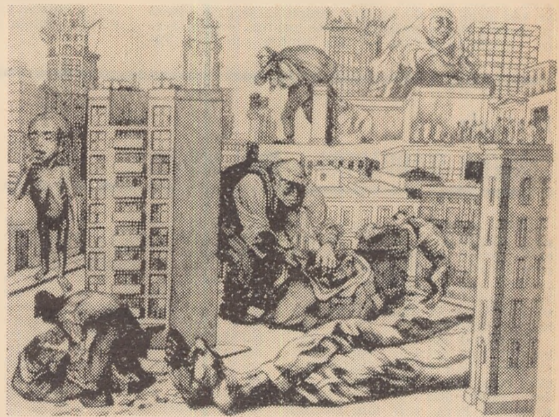
Alfredo ZALCE :

Ducîndu-l în Pădurea Purpurie Să iasă-un pui de vis și ciocirle.