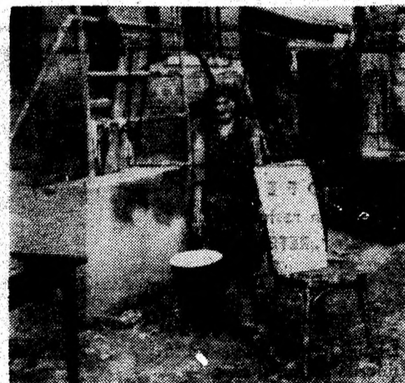
Cu gălețile, apa și nămolul sînt scoase din locuințe...