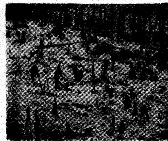
Aici a fost o grădina de legume...