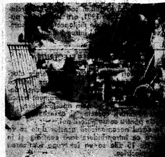
Agoniseala de o viață...