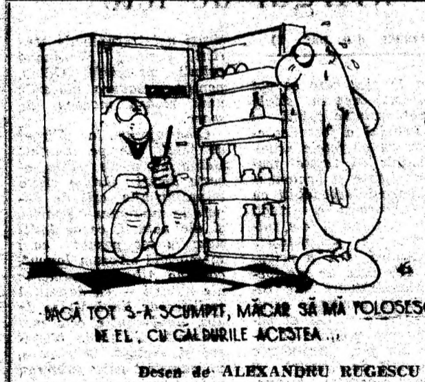
MACĂ TOT S-A SCUMPT, MACĂR SĂ MĂ POLOSESC ME EL, CU GÂLBURILE ACESTEA...