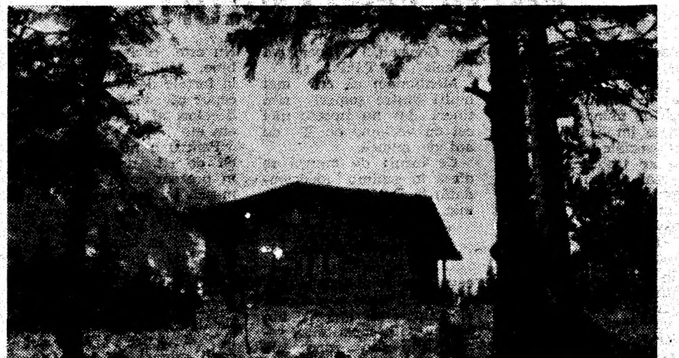
Cabana „Gentiana” — 1670 m altitudine.