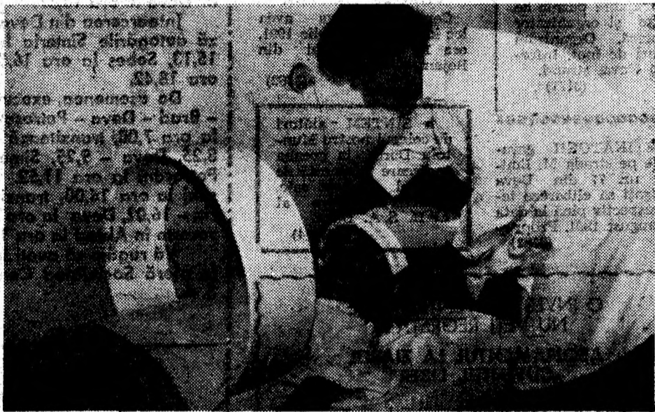
La Geoagiu-Băi, tratamentele se fac sub atenta observație a specialiștilor.

Doritorii se pot adresa la telefoane 16147 — 23024 Deva, între orele 7,30—15,30.