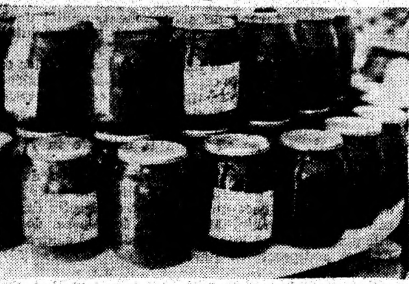
Spanac - frunze la borcan, cu data de fabricație: 18 mai 1989, își mai așteaptă cumpărătorii la magazinul alimentar nr. 1 al S.C. „Comsim” S.A. Simeria. Dar cine se mai încumetă? !

me, în timp ce untul și mălaiul nici nu se mai iau în calcul. Sînt la liber. De fapt, lipsesc cu desăvîrșire de luni de zile. Situația este valabilă și la Simeria, ca de altfel în întreg județul. Față de această situație critică în aprovizionarea populației județului cu alimentele de bază, de necesitate stringentă ale vieții de fiecare zi, considerăm că se impune ca toți factorii implicați în această activitate să manifeste mai multă înțelegere, responsabilitate și discernămint, atît în aprovizionare, cît și în repartizarea fondului de marfă. Sigur, nu avem suficiente produse în țară, iar ministrii de resort ne cam duc cu zăhărelul, spunîndu-ne că au intrat în țară atîtea și atîtea tone de zahăr, pe care însă pu-l vedem în magazine. Dar măcar cantitățile pe care totuși le primim să le repartizăm rațional, echilibrat și, mai ales, într-un mod civilizată, curat și igienic. Legat de aceste aspecte, este cazul să spunem că unele magazine alimentare gem de sucuri străine. la prețuri foarte piperate, că în altele sînt cantități mari de conserve de fructe și legume cu „vechime” apreciable și aspect îndoielnic, că altele vin de la producători fără etichete, ori cu etichete străvezii, urfe, și-fonate, pe care nu se prea poate descifra ce scrie, că aspectul estetic al unor magazine alimentare și curățenia din ele lasă încă mult de dorit.