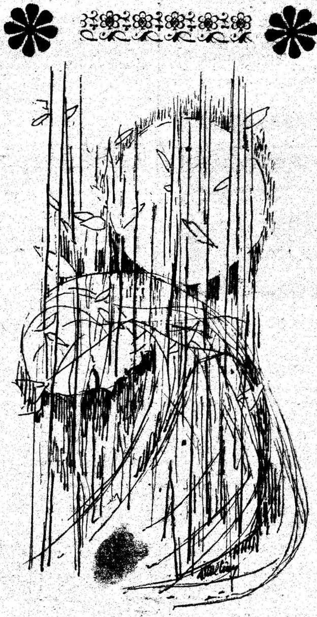
DORINA ITUL CRÂNG