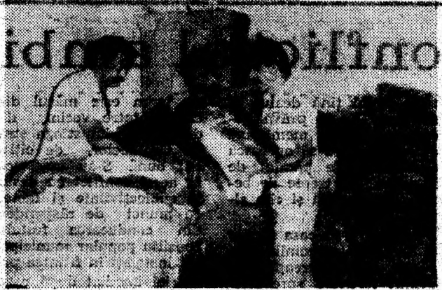
Ajutare pentru sinistrații din Moldova pregătite și expediate de salariații U.I.C.M. Deva.