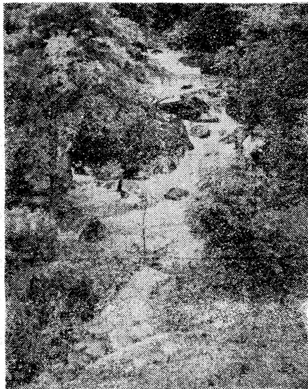
Vedere din Retezat.

• Abonamentele pentru luna septembrie, la cele mai accesibile prețuri cu puțință, se fac la oficiile poștale, factorii poștali și difuzorii din instituții, reșii și societăți comerciale, pînă la data de 29 august 1991, inclusiv.