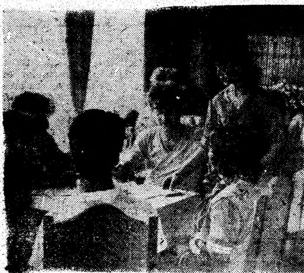
Imaginile reprezintă aspecte de la noul restaurant „Național” din Brad.