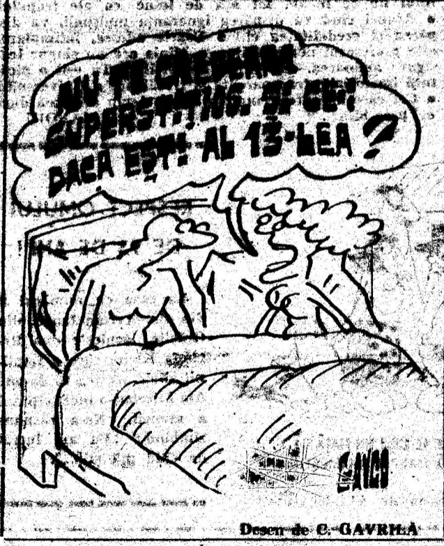
Desen de E. GAVRILA