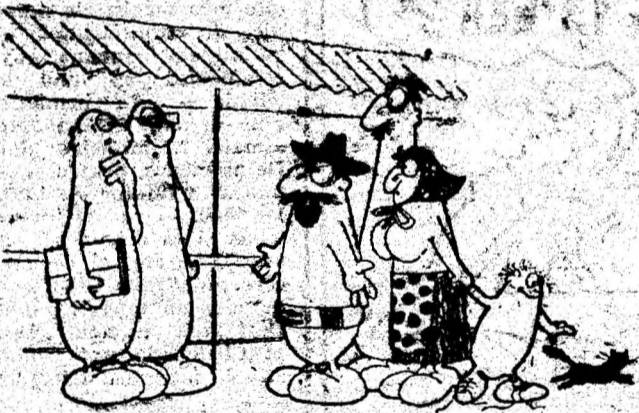
SĂRIȘORILE CONSOLE, SCAPĂ-NE DE RUȘI DIN PIATĂ CĂ AU MARE CĂ ÎN UN EFECT... SI DA MANDEA FALIMENTU!