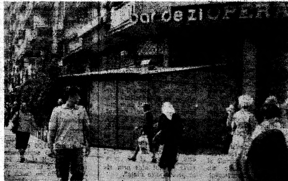
Dughenizarea pătrunde cu pași repezi și la Deva. Iată, o oribilă baracă, vopsită strident, a invadat trotuarul din fața barului de zi „Opera” din Deva. Este o adevărată pată ce maculează ținuta arhitectonică a bulevardului.