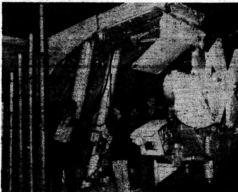
De la furnizorii din țară, minerii așteaptă utilaje de calitate, fiabile.

Tot în acest domeniu, se înscrie și înființarea la mina Lupeni a unei formații de recuperare a materiale care, printr-o muncă asiduă, conștiincioasă, reușește să recupereze din subteran, în urma unor intervenții și reparații de către „Service“, însemnate cantități de piese, subansamble și alte materiale, dintre care unele se reintroduc în circuitul productiv.