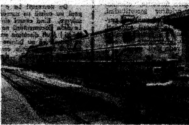
In gara Deva. Gata de drum...