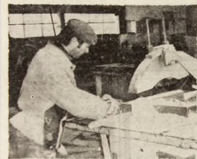
Cheresteaua se pregătește cu îndeminare și migală.

Informații suplimentare la telefon 42350 sau la sediul unității, din str. Luncei, nr. 3, Orăștie. (182)