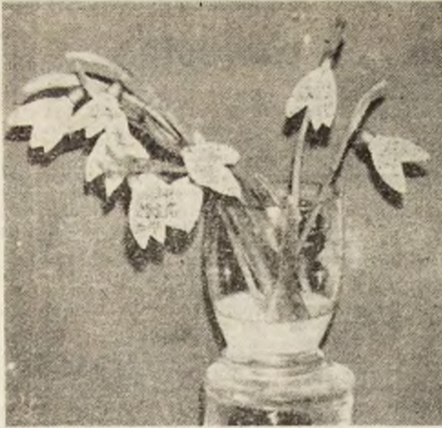
Vestitori ai primăverii.