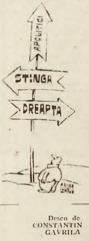
Desen de CONSTANTIN GAVRILA

Culese și adaptate de Dr. GH. MĂRII Deva