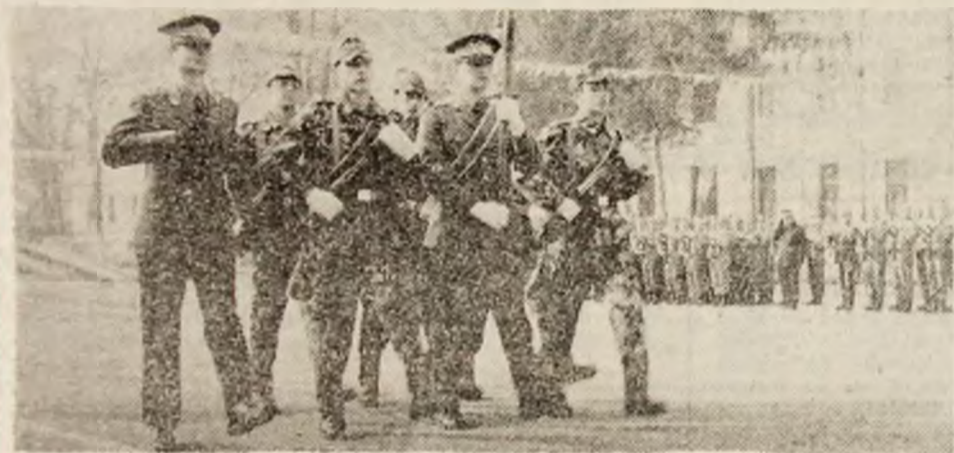
Aspect de la depunerea jurământului militar.