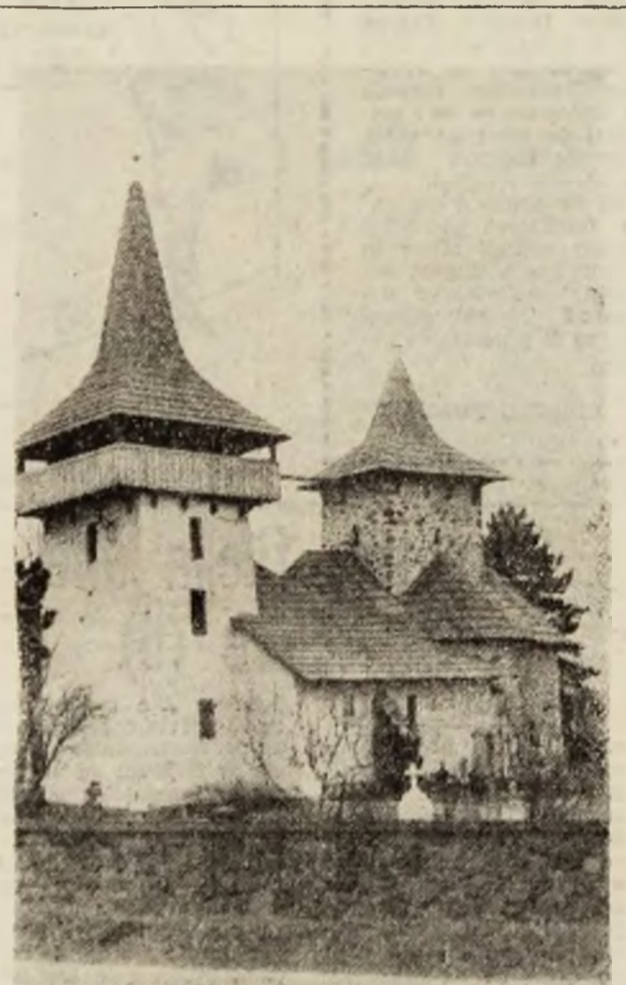
Biserica ortodoxă din Gurasada, construită în sec. XIII și este declarată monument istoric.

Pentru cei mai mulți, „Crucea Roșie” de la noi se identifică cu acea organizație care asigură oamenilor medicamentele străine, alte ajutoare. În realitate ea înseamnă mult mai mult. Constituită la 4 aprilie 1876, Societatea de „Cruce Roșie” din Româ-