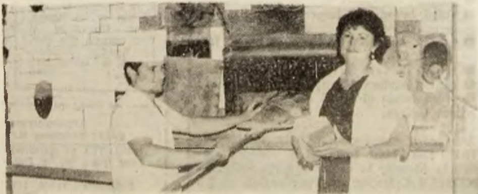
CONSUMCOOP BĂIȚA. O nouă șarjă de piine la drumul magazinelor de desfacere.

● Conducerea CONSUMCOOP BĂIȚA ADRESEAZĂ TUTUROR LOCALNICILOR și CELOR ÎN TRECERE INVITAȚIA de a-i vizita cu încredere unitățile.