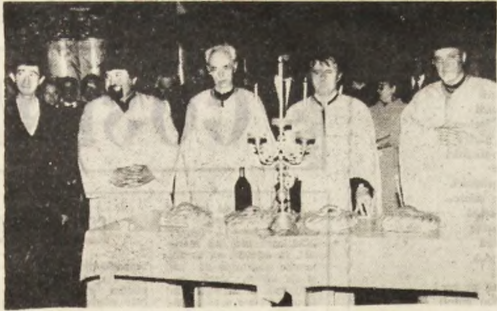
Slujba de pomenire cu ocazia sărbătorii creștinești a înălțării Domnului și Ziua Eroilor, la Catedrala Sfântul Nicolae din Deva.