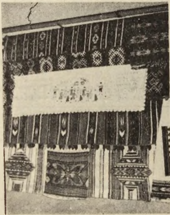
Motive populare din zona Orăștiei.

A consenat LUCIAN IFTA, subinginer, Hunedoara