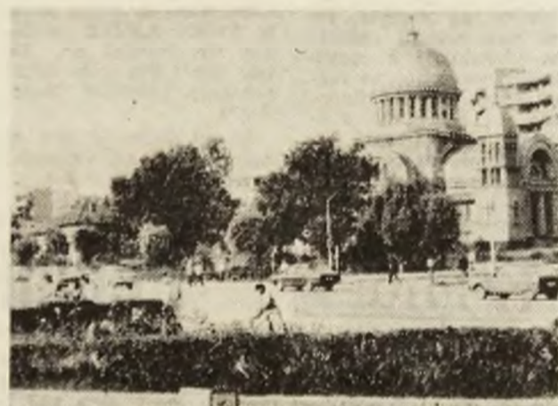
Deva în plină vară.