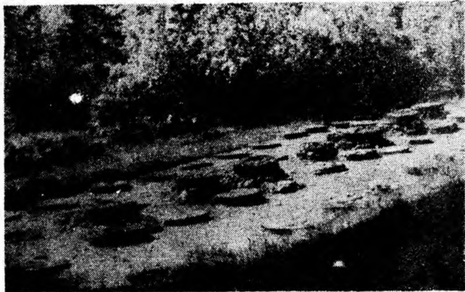
Mărturie ale obirșiei și statorniciei în vatra strămoșească. Sanctuarul patrulei de la Grădiștea Muncelului.

• Dacă oamenii ar putea VEDEA cu adevărat ce gîndesc alții despre ei, le-ar veni foarte greu să rămînă politicoși.