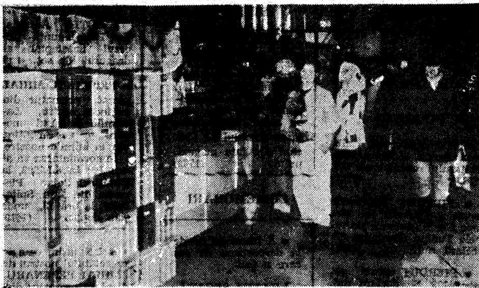
La magazinul alimentar nr. 25, din hala pieței Hunedoara, prima piine pe anul 1993, a „intrat” abia marți, 5 ianuarie 1993, ora 11. Este și aceasta o coordonată a grijii față de om...

neral (brutăria este închi-să de mai multă vreme — n.n.), cu punerea în posesie a pădurilor la proprietarii de drept (ca urmare a insuficientului sprijin din partea Romsilva), precum și cu aplicarea Legii fondului funciar. Aceste neajunsuri ce persistă se regăsesc atît în scrisoare, cît și în relatarea primarului, care ne-au cerut să facem cuvenita precizare. În speranța că asemenea aspecte regretabile vor fi evitate, ne cerem scuze cititorilor ziarului nostru și li asigurăm că în noul an ne vom spori exigența față de reflectarea cu veridicitate a faptelor, respectarea adevărului constituind profesunea noastră de cre-dință. (N.T.)