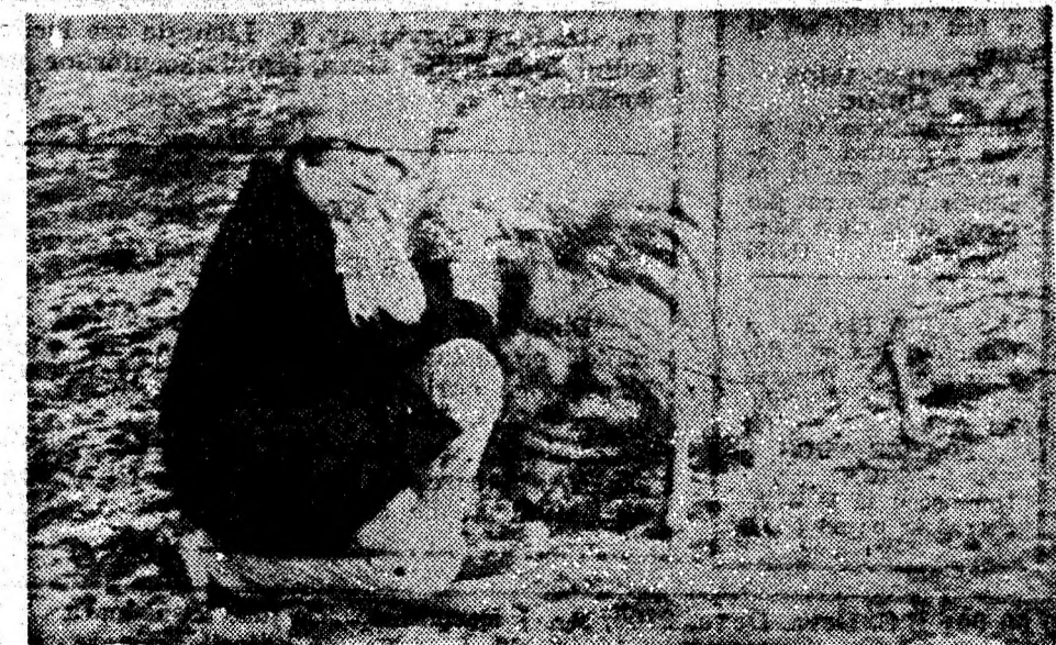
Se apropie vremea mieilor.