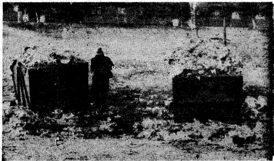
Foto 3: Cartierul Bejan, la bifurcația străzilor Bejan și Streiului.