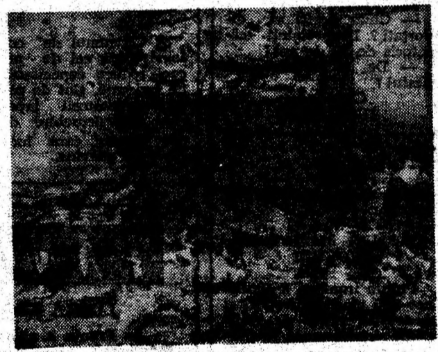
Foto 1: Strada Octavian Goga — Deva, în spațiile hotelului „Bulevard“.