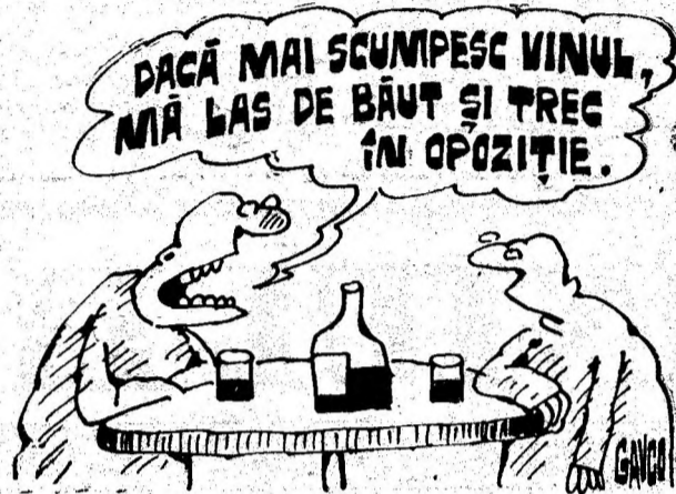
Desen de C-TIN GAVRILA

■ Consumul de cofeină după cel de alcool reduce capacitatea de judecată, sint de părere cercetătorii japonezi, spre deosebire de cei români, care încă nu s-au convins.