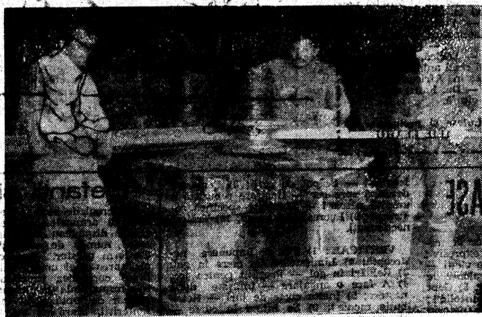
Presă de confecționat armături — realizată prin efort propriu —, aduce unității importante economii.

Aș aminti aici doar o măsură pe care am luat-o din 1991, de când transportul muncitorilor se face cu mijloace proprii, renunțând la serviciile altora — fapt ce a contribuit nu numai la reducerea cheltuielilor, ci și la întărirea ordinii și disciplinei, a punctualității în general.