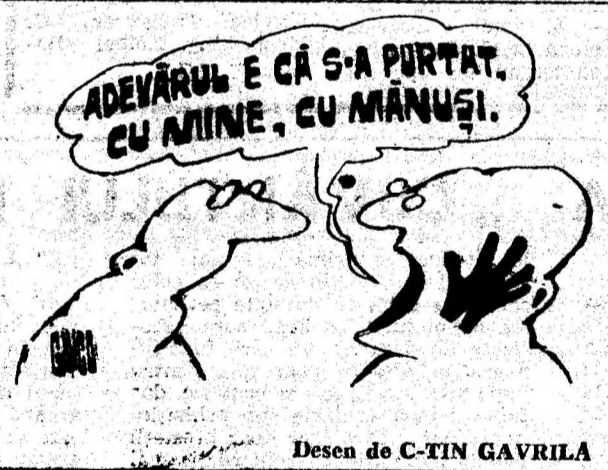
Desen de C-TIN GAVRILA

Începând cu data de 15 iunie veți putea cumpăra ziarul și la chioscurile de difuzare a presei. (4692)