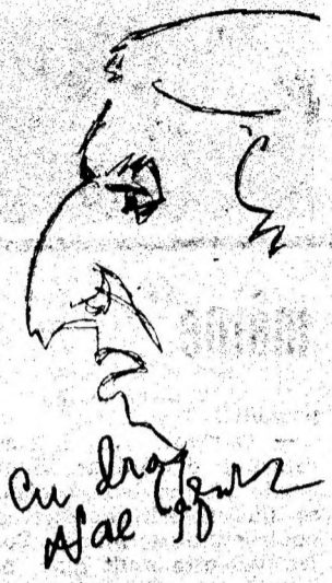
Nae Lăzărescu — autoportret cu dedicație.