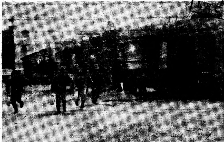
Aspect din pregătirea specifică la Grupul Județean de pompieri Deva.

În această situație, ținându-se seama și de actuala conjunctură economică, rugăm agenții economici cu capital de stat sau privatizați, pe oamenii cu frica lui Dumnezeu ca, în măsura posibilităților, să ne ajute cu sume de bani, pentru a se putea realiza acea construcție cu profil social, având încredere că aportul pe plan material se va regăsi și pe planul spiritual, atât de palid conturat, mai ales astăzi. Contul nostru este 45.10.7552 BC Tg. Mureș.