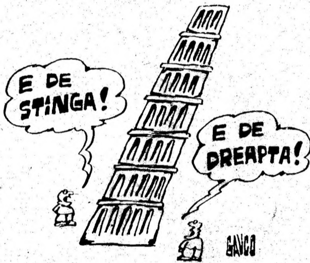
Desen de CONSTANTIN GAVRILA