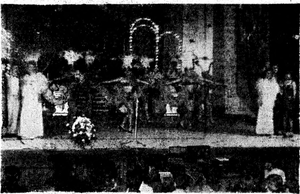
Spectacolul de revistă presupune fast, muzică bună, momente umoristice pe măsură... De toate acestea a beneficiat premiera Teatrului de Revistă și Comedie din Deva — „E bine... bine... e... vai de mine”.