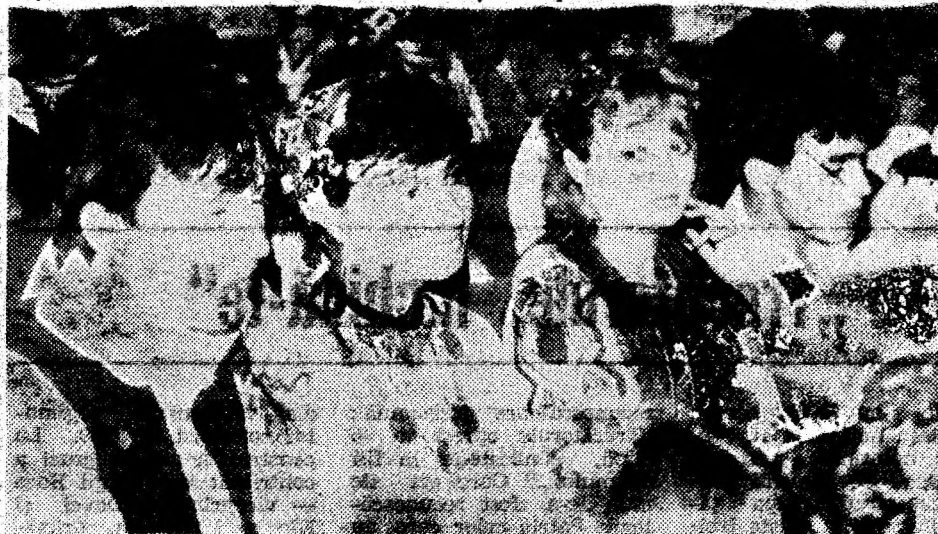
Participanți la ediția I a Festivalului folcloric internațional „Sarmizegetusa”.

Cultură Hunedoara, Centrul Județean pentru Cercetarea și Valorificarea Creației Populare, Organizația Internațională de Folclor, mult succes! MINEL BODEA