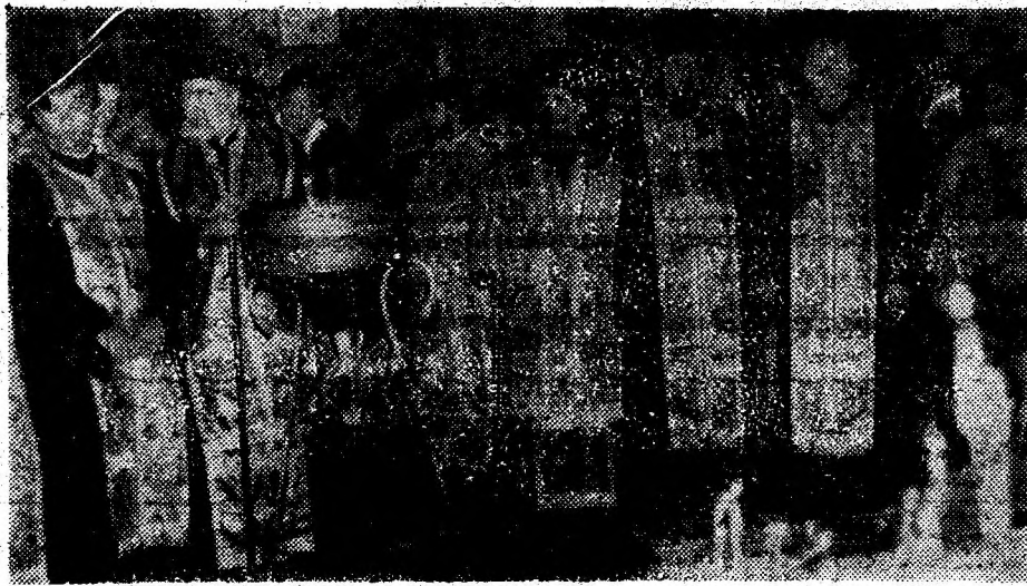
Un sobor de preoți oficiază slujba religioasă comemorativă.