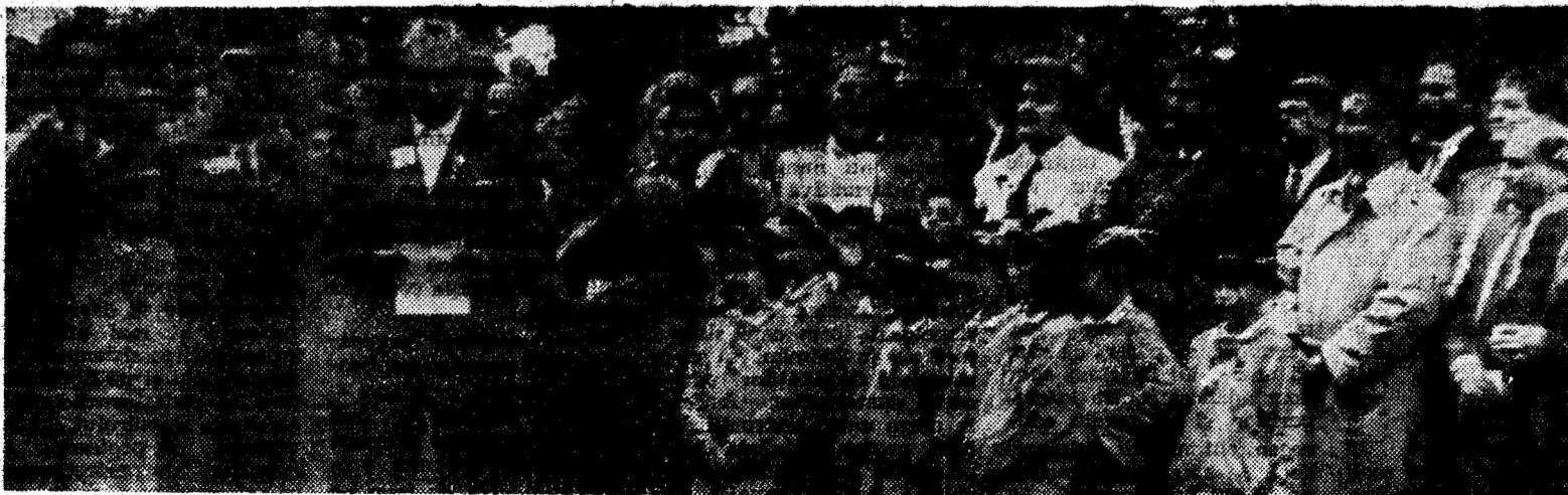
Moment comemorativ la Pantheonul neamului de la Tebea.

Și la Facultatea de Mine s-au creat posibilități de continuare a studiilor la mai multe specializări — ne-a comunicat dna Bira Etelka, secretar șef al facultății. La specializarea exploatarea miniere, cursurile serale, s-au prevăzut 10 locuri, la exploatarea miniere — 5 locuri (tot cursuri serale), iar pentru anul III topografie minieră — 5 locuri, cursuri de zi. Și aici înscrierile se fac până la 17 septembrie, ora 15, iar admiterea va fi susținută la 22 septembrie. La decanatul Facultății de Mine sunt așezate date suplimentare privind disciplinele și orarul. (L.L.)