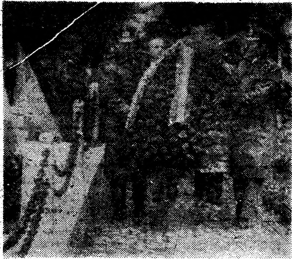
Se depun coroane de flori la mormântul lui Avram Iancu.