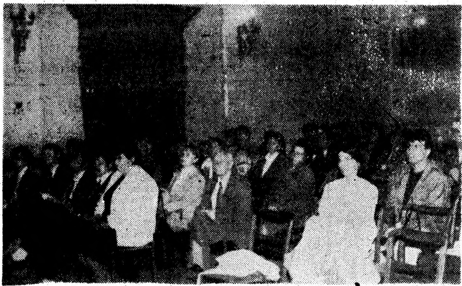
Aspecte din timpul desfășurării simpozionului științific internațional găzduit de municipiul Deva.