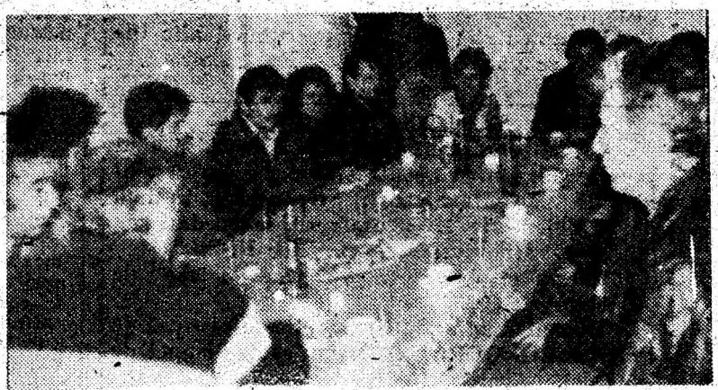
Cu tipografilor, la aceeași masă, într-o discuție amicală.