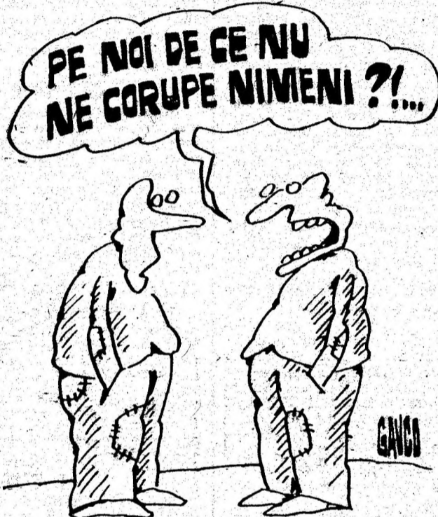
Desen de CONSTANTIN GAVRILA

Cum să visezi la fastuoase baluri — Ca în poveștile de Frații Grimm, Când ultimele noastre idealuri Le-am spulberat pe marfă la COMTIM ? DUMITRU HURUBA