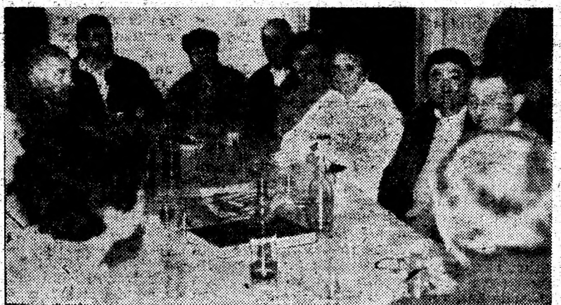
Discuție la redacție cu poștașii premiați.

ALEGERI DE PRIMARI LA VEȚEL ȘI BRANIȘCA Duminică, 14 noiembrie a.c., în comunele Branișca și Vețel vor avea loc alegeri pentru desemnarea noilor primari. Așa cum a anunțat și ziarul nostru, pentru funcția respectivă în Vețel candidau șapte cetățeni, iar în Branișca 6. Alegătorii sunt invitați să se prezinte la centrele de votare având asupra lor buletinul de identitate. (Tr.B.)