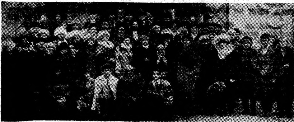
Corala Catedralei „Sf. Nicolae” Deva a împlinit 100 ani de activitate.