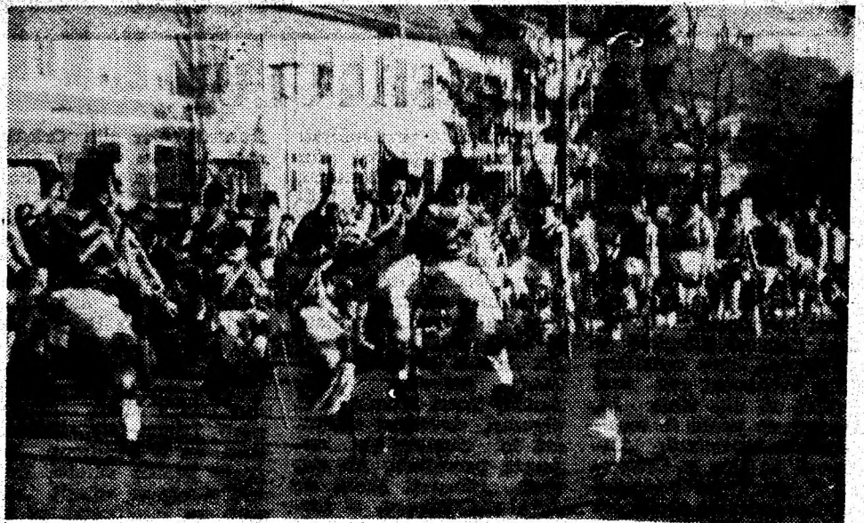
În iureșul dansului, călușerii din Orăștioara de Sus.