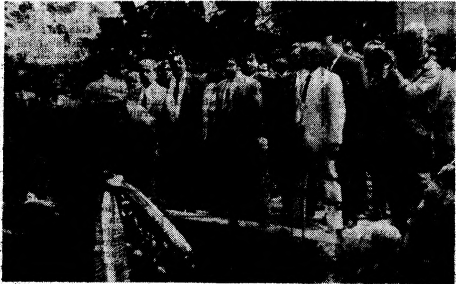
Cu pioșenie au fost depuse coroane de flori la mormântul lui Avram Iancu, omagiindu-l pe eroul național de la a cărui naștere se împlinesc 170 de ani.