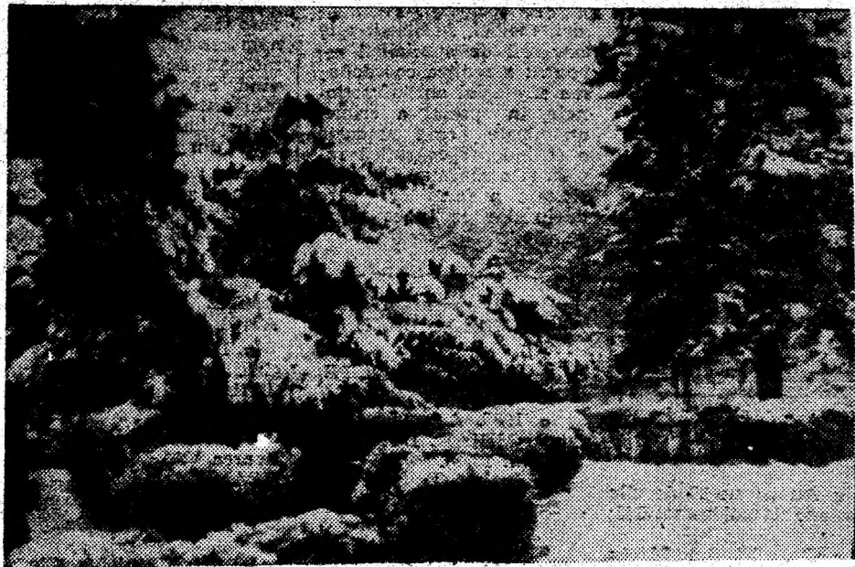
„Iarna-i grea, omătul mare...”

Salarizare deosebit de atrăgătoare. Selecția marți, 24 ianuarie a.c., la Sala sporturilor Deva, ora 12.