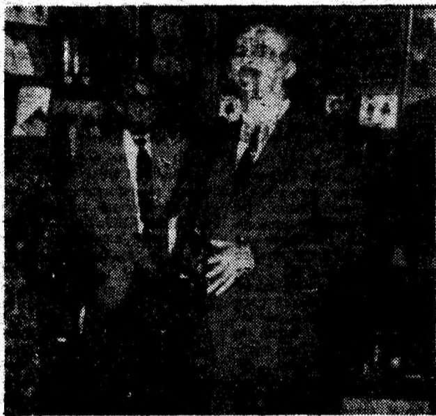
Lansare de carte la Casa Cărţii din Deva