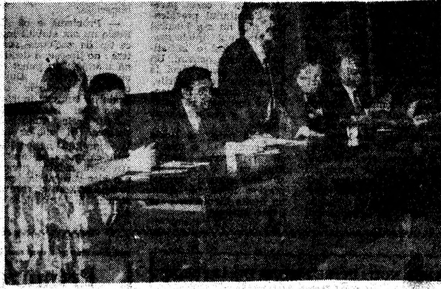
Participanţi la simpozionul din Deva dedicat Luceafărului poeziei româneşti

— Die profesor doctor Tudor Oprea, cât e de veche preocuparea dumneavoastră faţă de promovarea creaţiilor literare ale copiilor şi adolescenţilor?