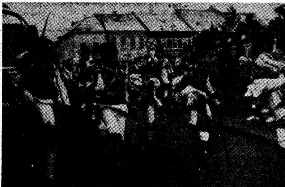
Tradiții ale jocului popular românesc, valorificate de un mare număr de tineri din județ.

The Silence și Eyes Of A Stranger. Acest maxi a fost singurul disc care nu s-a bucurat de aprecierea publicului larg,