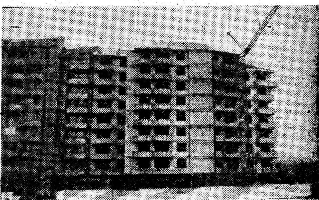
În Hunedoara, mult așteptate și râvnite de tinerele familii, apartamentele prind contur.

S.A.: Mi-a adus multe. Satisfacția de a vedea obiectele muncii mele dorite și cumpărate de clienți. Faptul de a nu mai fi nevoit să aștepti ordine pentru a întreprinde ceva, eu fiind acum cea care hotărâsc ce e bine și ce e rău în viața firmei. Sigur, necesitatea de a fi minim 10 ore pe zi în priză directă cu producția îmi răpește foarte mult din timpul care, în alte condiții, l-aș fi dorit petrecut cu familia mea, cu copiii în special. Or, frustrarea aceasta nu este ușor de dus.