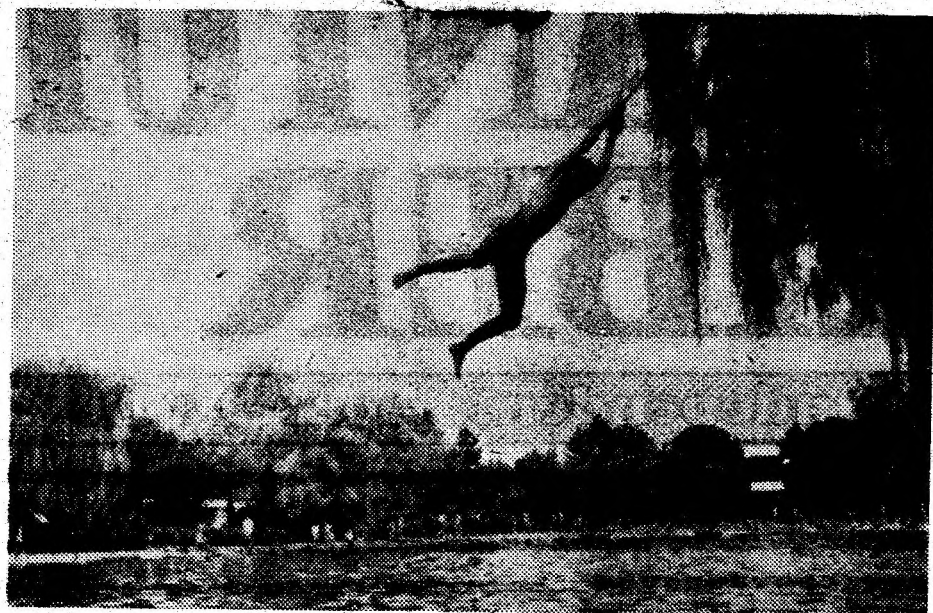
Un Tarzan modern.