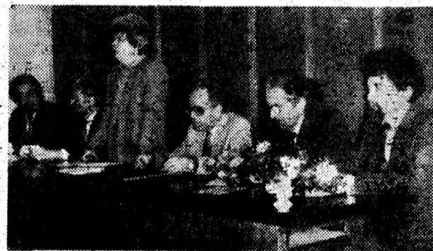
Oameni de cultură la întâlnirea cu publicul.