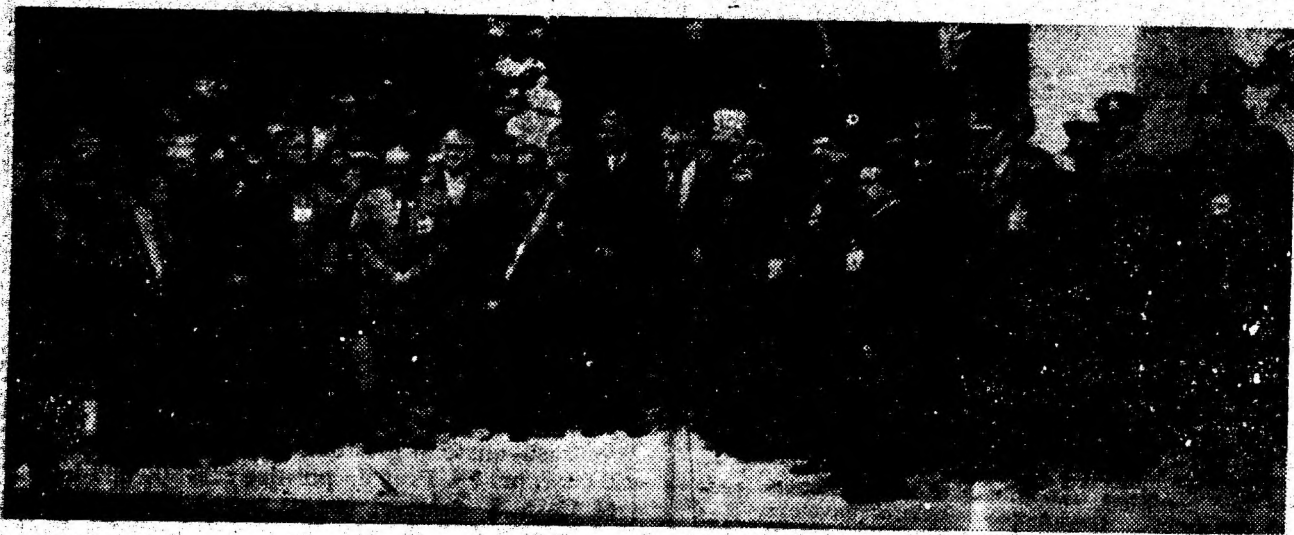
In preajma gorului lui Horea, oaspeții Tebei zâmbesc a paratului fotoreporterului nostru într-o poză de „familie“ a monumentului.