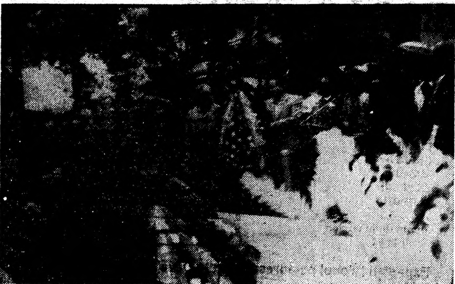
Redacția ziarului nostru a depus în semn de profund omagiu o coroană de garoafe albe la mormântul lui Avram Iancu.