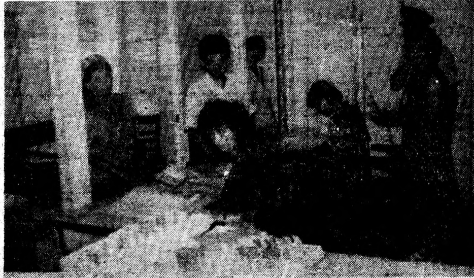
Aspect de la distribuirea cupoanelor de privatizare, la punctul de desfacere de la Liceul Auto Deva.

S-a obținut și Acordul nr. 840/2.05.1995 al Ministerului Finanțelor cu privire la aprobarea documentației tehnico-economice pentru obiectivul de investiții „Cămin cultural” în comuna București. Pe baza acestui acord, urmează ca în anul viitor să se cuprindă în plan fondurile aferente; la momentul adoptării bugetului, vă vom mai informa.