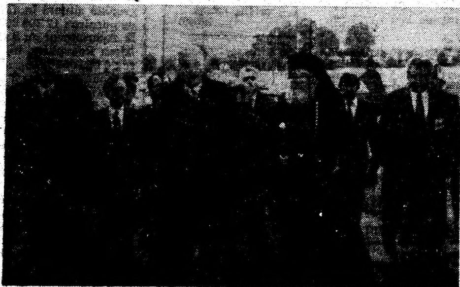
Oaspeți de seamă au onorat cu prezența lor „Serbările naționale — Tebea '95“, omagiind marea personalitate a eroului național, Avram Iancu.