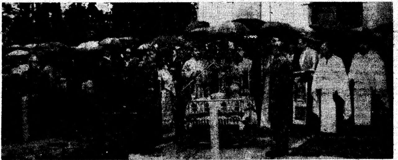
Duminică, la Tebea, un sobor de preoți, avându-l în frunte pe Prea Sfinția Sa Timotei, a. oficiat o slujbă de pomenire.