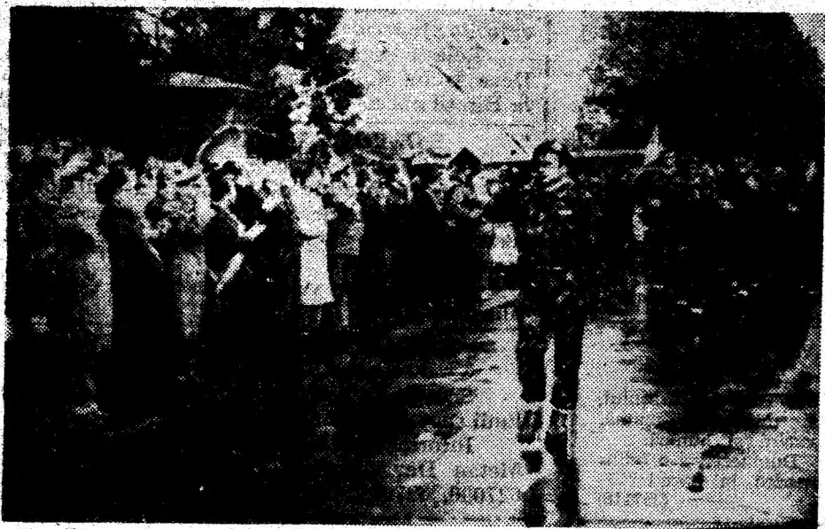
A fost trecută în revistă garda militară de onoare, constituită cu prilejul manifestărilor naționale de la Tebea.