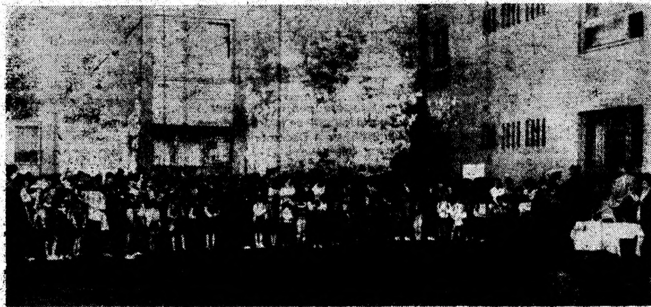
Aspect de la festivitatea de deschidere a noului an școlar, la Școala Generală Nr. 4 Deva.