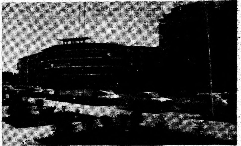
Vedere din orașul Simeria.

cei care trebuie să-și dea avizul, dar ezită să-o facă, este Ministerul Culturii. Obiecția este aparent majoră. De ce să cheltuim bani pentru pantheonul moților când sunt de restaurat atâtea biserici-monument, atâtea șantiere arheologice deschise și nefinalizate în județ.