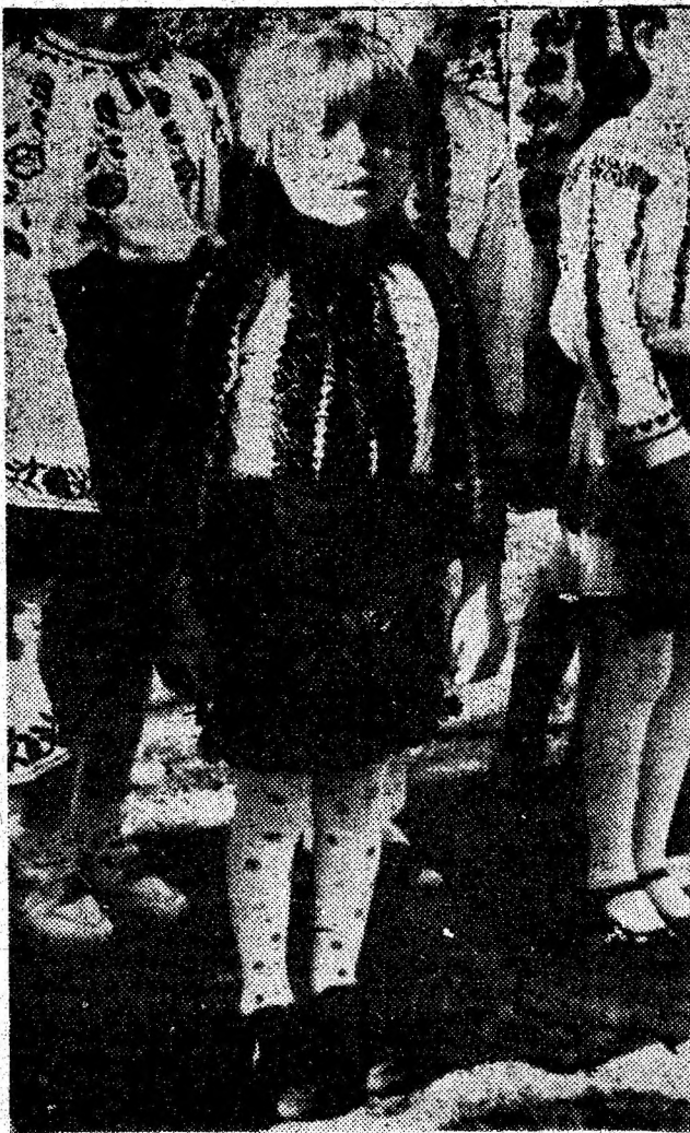
„Eu sunt fată de la moși și vă cânt cu drag la toți...”

■ Celelalte lucruri de mână (cusături), prosoapele artizanale țesute se calcă frumos și ușor cu ajutorul unei cârpe ude, puse peste ele și apoi dat cu fierul.