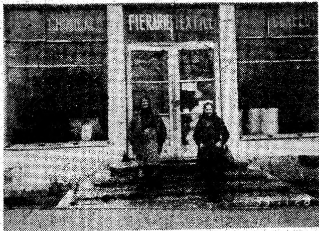
O veni, n-o veni? Conform programului afișat, trebuia să fie aici la 8. Este 9,40, dar ușa magazinului sătesc din Tirnava de Criș e tot zăvorâtă. Spre știința celor interesați — se întâmplă în 28 noiembrie a.c.