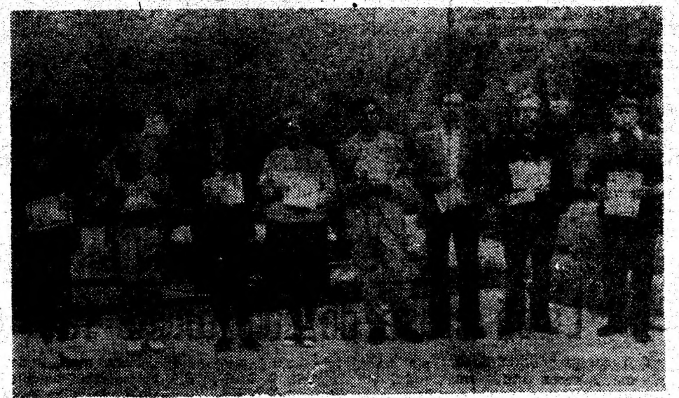
Câștigătorii etapei a XX-a a concursului „Marșul factorilor poștali” de la Hunedoara.

Una pe zi „Niciodată nu este mai înjosită specia umană decât atunci când prostia este înarmată cu putere”. VOLTAIRE