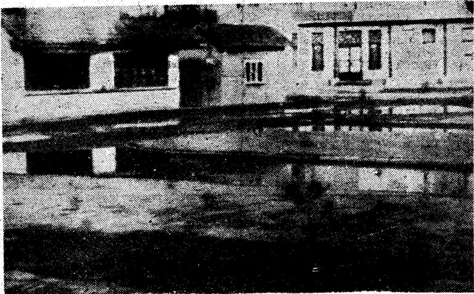
Așa arată o parte a „bătrânei“ piețe a tânărului municipiu Brad.