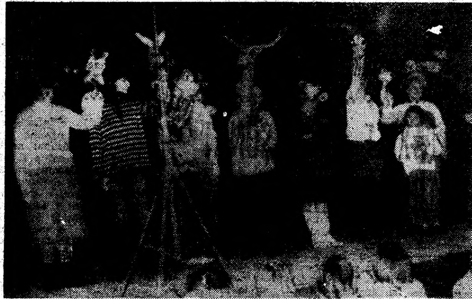
Formația de teatru de păpuși a Casei de cultură din Deva în timpul unui spectacol

Meritul de a-l aduce în grup pe Randy Rhoads îi revine tot lui Sharon, care îi va facilita lui Ozzy semnarea unui contract cu casa Jet Records. Rhoads, un tânăr de 21 de ani, din California, profesor de chitară și fondatorul grupului Quiet Riot, este un chitarist de excepție, un tehnician desăvârșit, unul dintre cei mai valoroși chitariști din noua generație americană. Tehnica lui Rhoads s-a suprapus perfect vocii lui Ozzy, cei doi împrietenindu-se rapid și formând un cuplu de muzicieni și compozitori de nedespărțit.