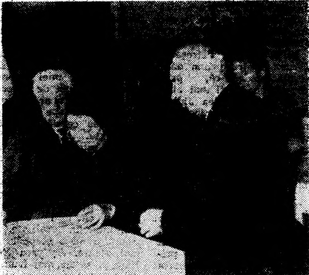
La secția de votare nr. 2 din Lupeni se votează cu speranța unor zile mai liniștite.